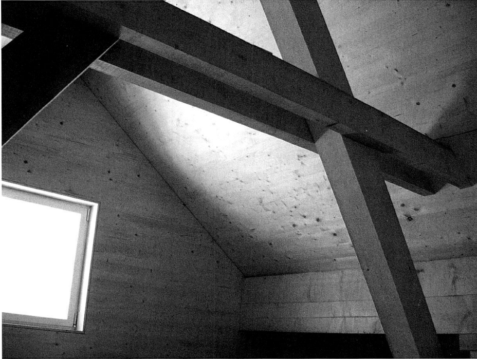
Im Obergeschoss der Sennhütte soll vielleicht für Wanderer ein «Schlafen auf der Alp» eingerichtet werden.

alle Ziegen gemolken und verschwinden wieder in die Berge. Ihre Milch fliesst einen Gebäudeteil weiter in die Käserei, wo zwei «Kessi» stehen, damit unterschiedliche Produkte hergestellt werden können. Gekühlt wird mit Wasser, das von weither geholt werden musste, weil die bestehende Quelle zu wenig hergab. Dasselbe Quellwasser betreibt eine kleine Turbine, die die ganze Alp mit Strom versorgt. Auf einem Geschoss ist zuunterst im Gebäude eine einfache Sennhütte eingerichtet. Unter dem Dach können vielleicht mal Wanderfreudige, die beim Aufstieg in die Greina hier vorbeikommen, in einem Massenlager übernachten. «Schlafen auf der Alp» nennen das die Architekten. Im Keller wird der Käse gelagert. Die Schweine im Nebenhäuschen fressen die Abfallprodukte der Käseherstellung.