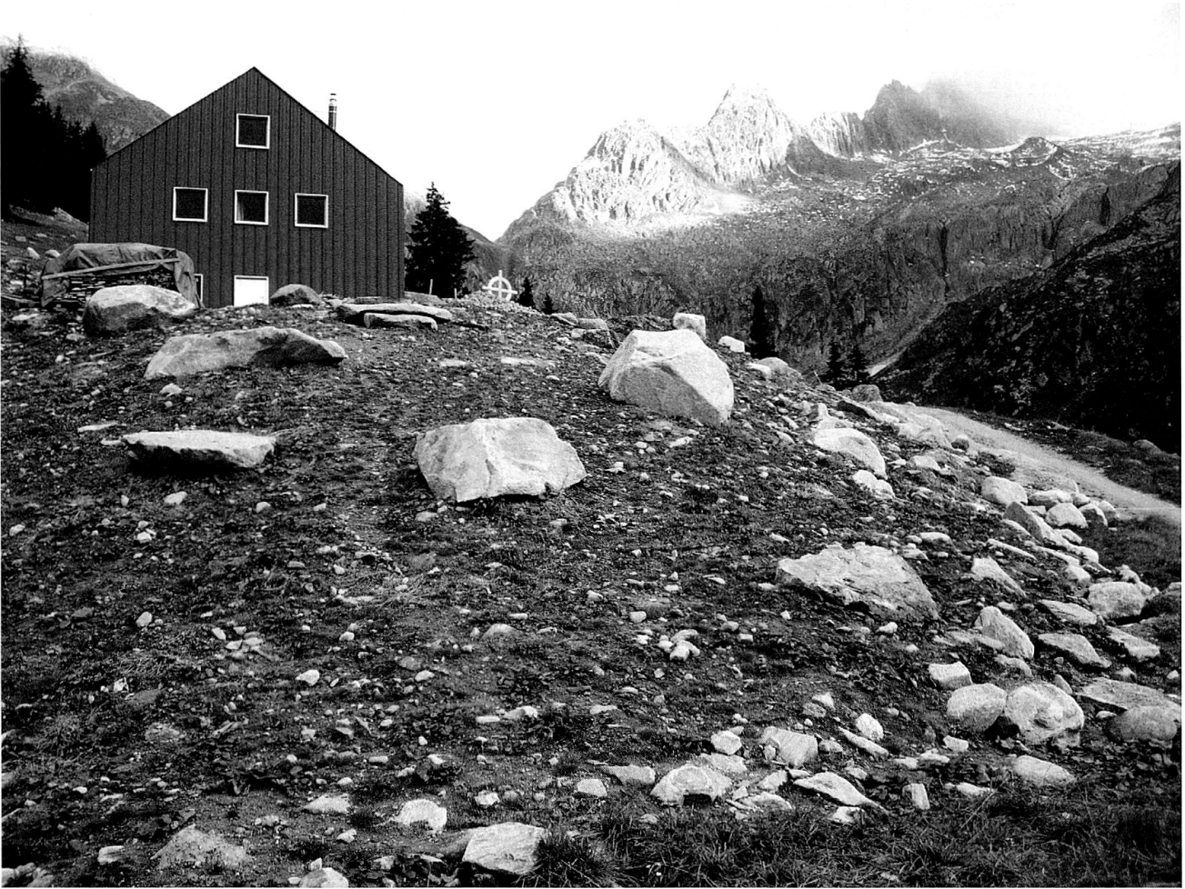
Der Neubau liegt oberhalb Fuorns auf 1850 Metern.