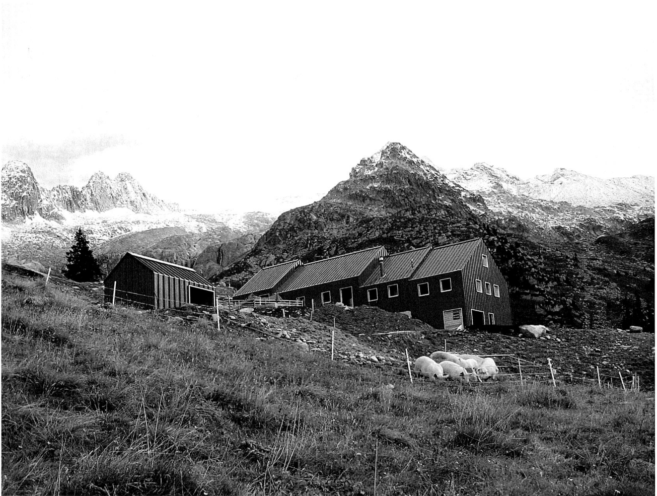
Das Alpgebäude ist dem Terrain folgend abgetreppt. Vorne der Schweinestall im gleichen Material.