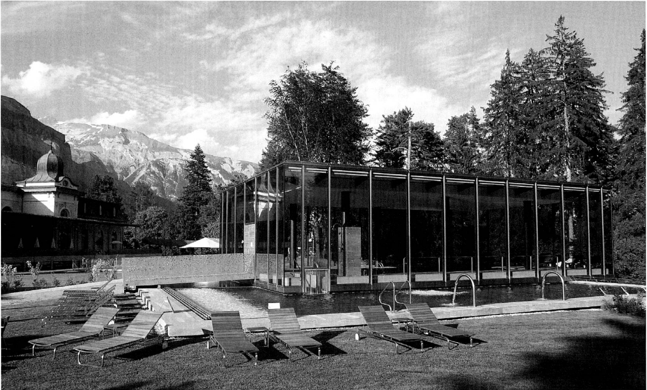
Wellnesskubus im Park des Hotel Waldhaus, Flims

dass der Publikumsgeschmack befiehlt, und der richtet sich meist nach dem Preis-Leistungsverhältnis, also nach der Frage, wie viele Quadratmeter Zimmer und wieviel Fernsehbildschirmfläche für das Geld zu bekommen sind. Umgekehrt misst die Hotellerie ihren Erfolg in der Auslastungsziffer, da ist der glückliche Gast nur indirekt vertreten. Deshalb also genügen meist teuer und billig als Kriterien. Und tatsächlich habe ich schon die aufgeschlossensten Kunstfreunde murren hören, dass sie im wunderschönen Furka-Hospiz in den hohen majestätischen Betten wie die Prinzessin auf der Erbse schlafen mussten. Bei der Matratze spätestens hört die Schönheit auf! Das Hospiz hat denn auch seinen Hotelbetrieb aufgegeben.