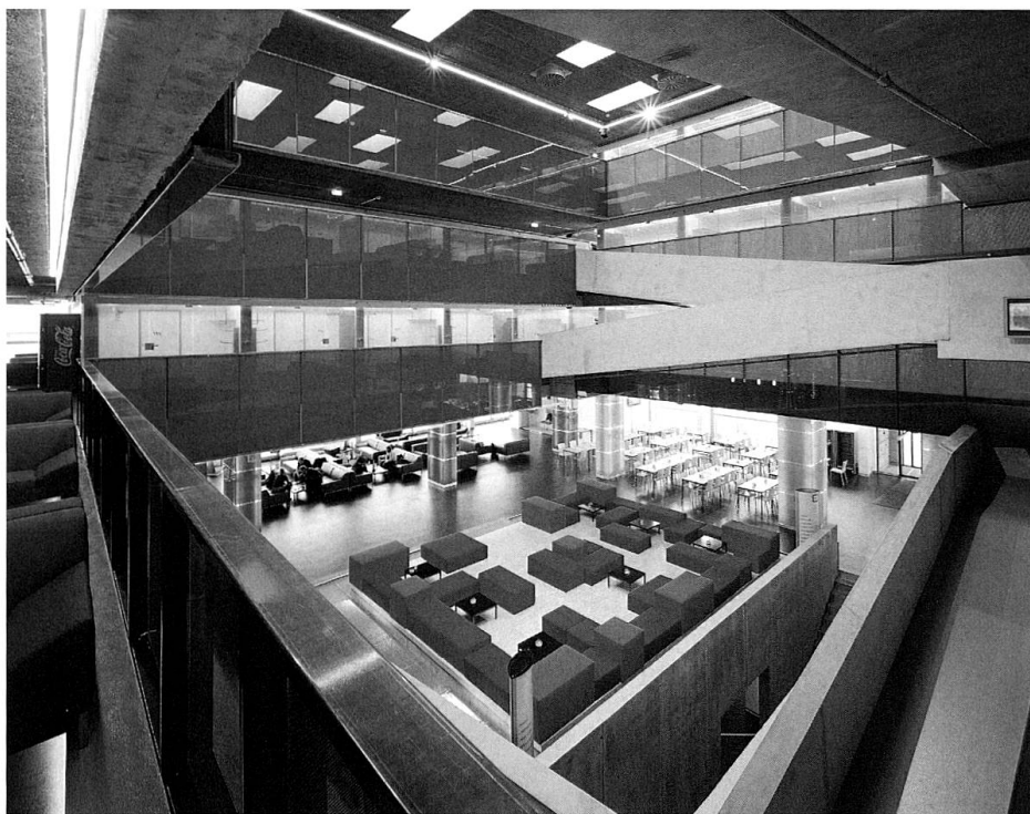
Die Halle im Cube Savognin

druck «Crew», sonst aber setzen sie sich auch einmal auf die Ledercouch neben einen Gast und plaudern über Savognin als Bikerparadies. Unkompliziert lautet die Strategie, mit möglichst wenig Angestellten viel Service zu bieten und gute Stimmung zu verbreiten. Unkompliziert auch ist der architektonische Auftritt des Hauses: Die robusten Oberflächen machen deutlich, dass der Gast mit Skischuhen und Skiern durch die Halle und auf sein Zimmer stiefeln darf oder im Sommer gar über die zentrale Sichtbetonrampe mit dem Edelbike bis ans Bett fahren kann. Jedem Gastraum sind so genannte Showrooms vorgelagert, semitransparente Vorräume mit Aufhängung für die Fahrräder, Skiständer, Skischuhbelüfter und viel Platz für nasse Kleider. Die Gäste demonstrieren, dass sie grössten Wert auf teure Markensportgeräte legen, die auch alle bestaunen sollen, es sonst aber schlicht mögen. Die Zimmer kommen denn auch ohne jeden Schnickschnack aus, die Kajütenbetten stehen im Vierzimmer dicht an dicht, Schränke gibt es keine, stattdessen verschliessbare Kisten, die sich unters Bett schieben lassen. Das Badzimmer ist als offenes Entrée zum eigentlichen Schlafräum angelegt, allein die Toilette ist abgetrennt. Selbst die beiden Suiten leisten sich nur den Komfort, mehr Platz anzubieten, sonst zieht sich die einfache Ausstattung durch. Schlafen ist hier, wie früher in den Grand Hotels, auf das Notwendigste beschränkt.