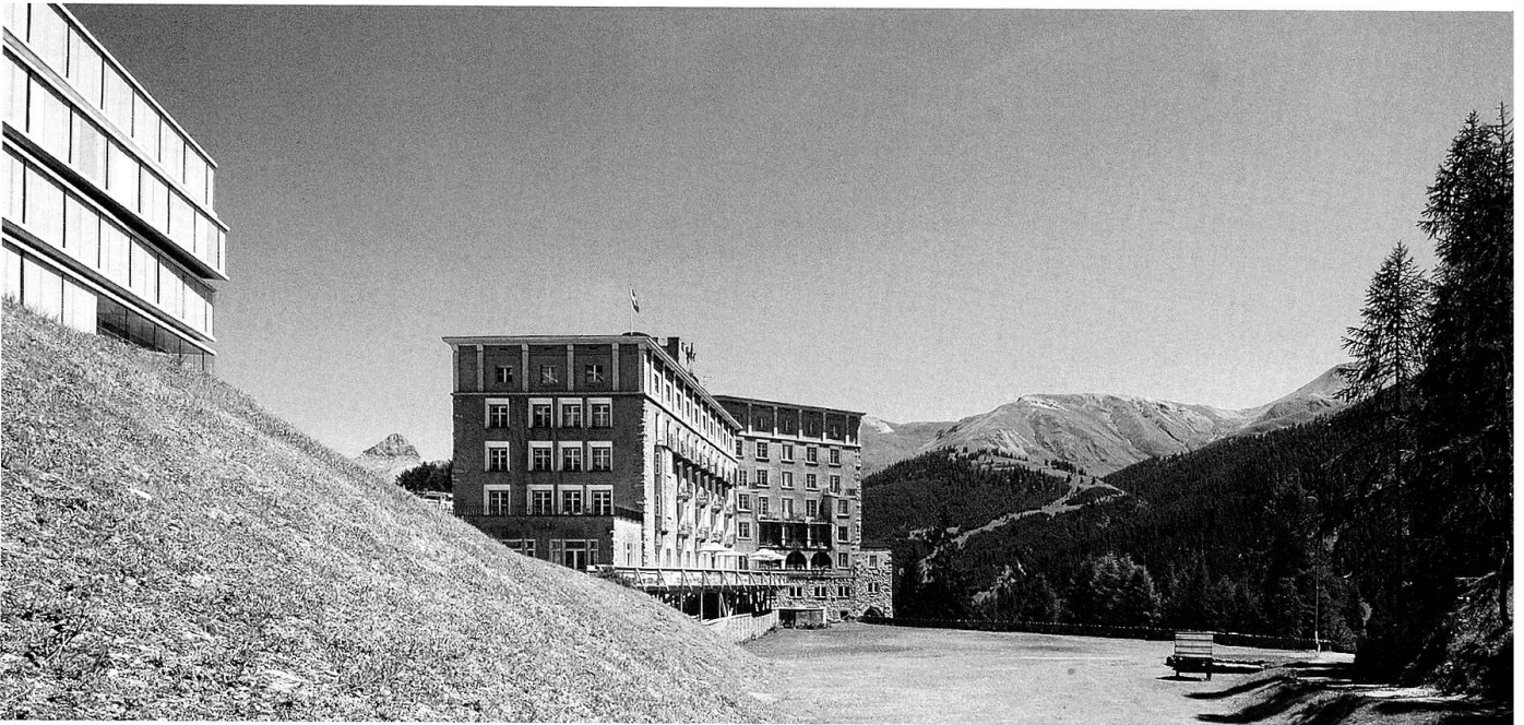
Das Castell in Zuoz mit Apartmenthaus von UN Stu- dio

dass nach 1945 kein Geld da war, umfassend zu sanieren, den alten Stuck abzuschlagen, Spannteppiche einzuziehen und die einst grosszügigen Flure durch dunkel geflieste Badezellen zu verbauen. Von den aktuell 25 Hotels, die dazu gehören, sind allein neun davon in Graubünden zu finden. Neben dem Palazzo Salis in Soglio, in dessen Himmelbetten man geneigt ist, in Rilke-Zitaten zu träumen, und dem Waldhaus in Sils Maria, welches sich noch jeden Nachmittag in den Klängen des Hausorchesters wiegt, gehört etwa auch das Hotel Albrici in Poschiavo dazu, ein ehemaliges Patrizierhaus mit herrschaftlichem Auftritt und prächtigem Sibyllensaal.