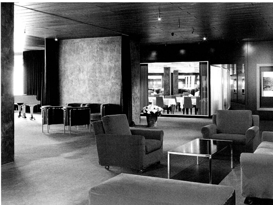
Die Halle des Thermenhotels in Vals, Foto Walter Mair

Bezeichnenderweise hat Elizabeth Main bei ihren Kategorien «sehr schön» weggelassen. Dies ist wohl ein überlegter Zug, ist es doch nirgends so treffend wie in der Hotellerie festzuhalten,