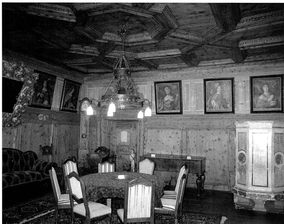
Der Sibyllensaal des Hotel Albrici in Poschiavo