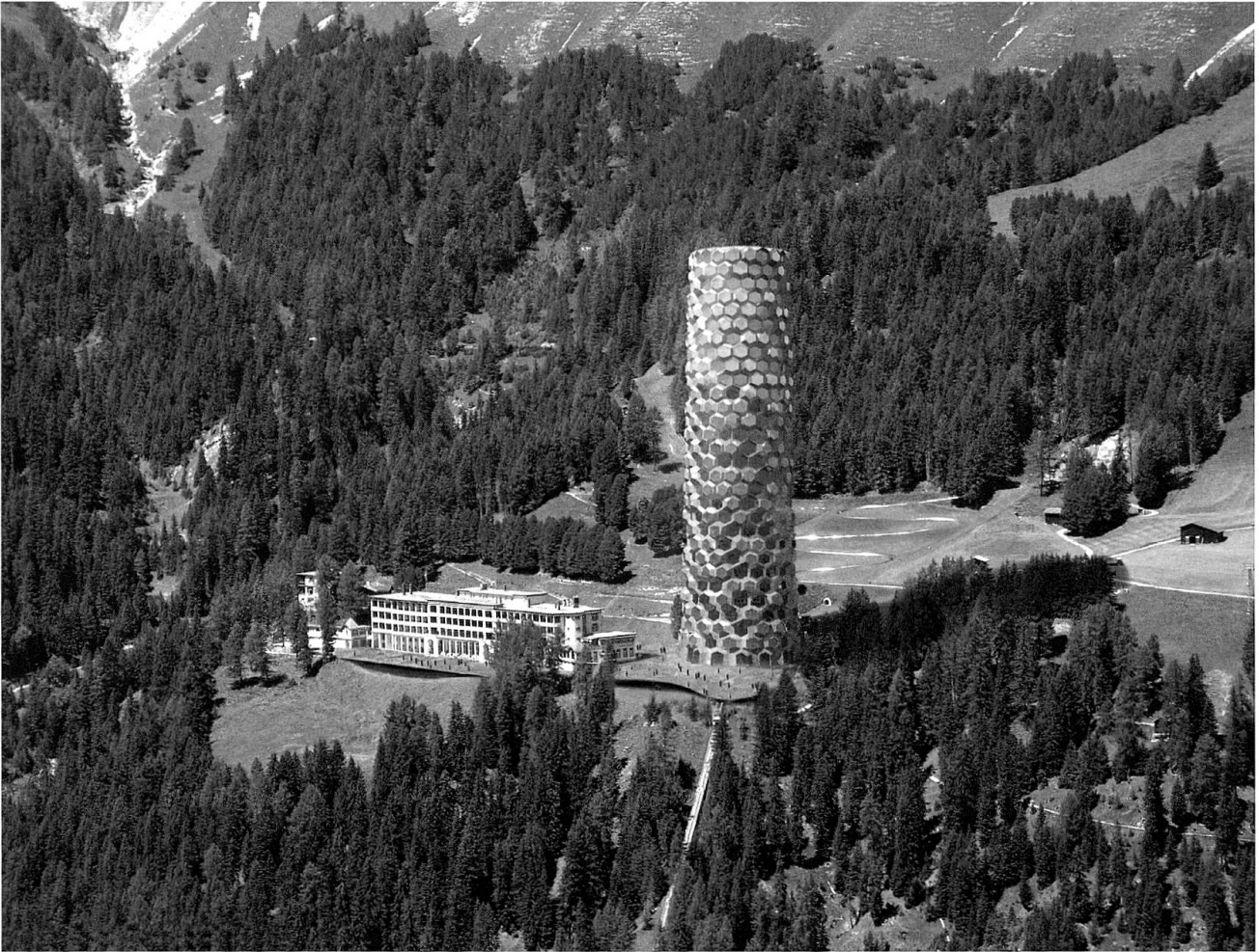
Das Turmprojekt von Herzog & de Meuron auf der Schatzalp