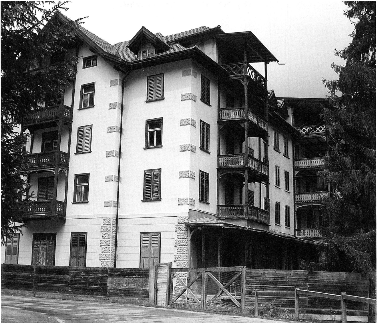
Das Waldhaus in Tenigerbad im Jahre 2006 (Foto: Dieter Kuhn, Diesentis/Mustér).

verändert, man blieb für kürzere Zeit und war mobiler. Langsam wandelte sich also das Tenigerbad zu einem Touristenort, der in den Jahren vor der Schliessung für den Ferienkoloniebetrieb genutzt wurde. Erst der Neubeginn mit ausländischem Kapital ab 1971 weckte neue Hoffnung. Durch einen Neubau und hohe Investitionskosten wurde das Tenigerbad modernisiert. Wiederum war der medizinische Anspruch hoch, daneben wurde ein umfangreiches Kulturangebot offeriert. Doch durch die Rezession der späten 1970er Jahre und die abgelegene Lage beeinträchtigt musste der Betrieb schon nach wenigen Jahren Konkurs anmelden. Die Pläne zur Vermarktung des Mineralwassers scheiterten ebenfalls, gerade die Bekanntheit des Wassers wäre aber der Schlüssel zum Erfolg des Kurbetriebs, wie im nahe gelegenen Vals deutlich wird. Bis heute steht also, neben einem grossen Waldhaus aus der Jahrhundertwende und einem kleinen Badehaus, eine der