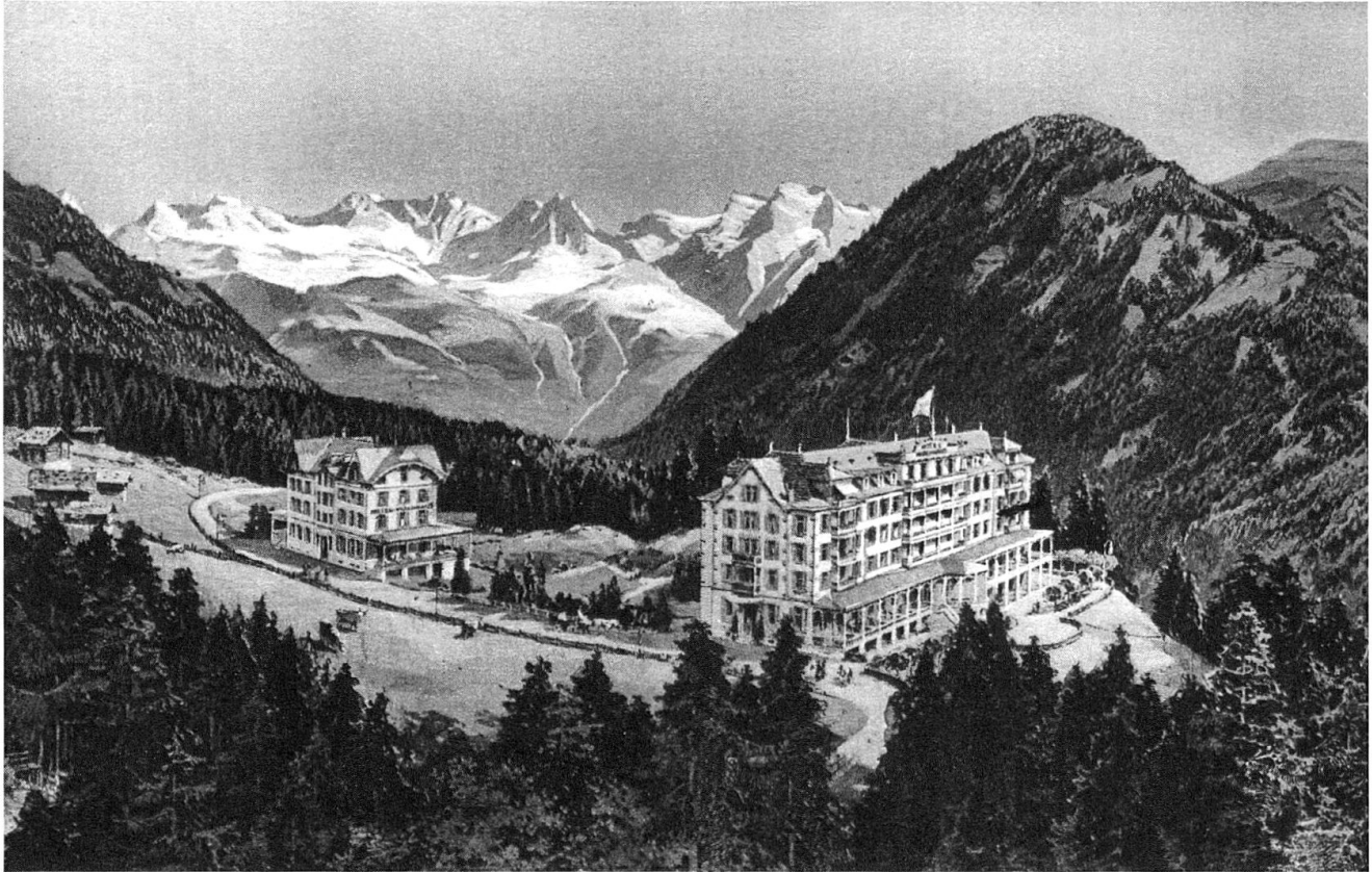
Tenigerbad, Hotel Waldhaus (Blick nach Norden), Postkarte um 1911 (Sammlung Konrad J. Kuhn, Zürich).

nung an die ursprünglichen Pläne, durch den Architekten Braun aus Chur etwas erhöht auf einer bewaldeten Terrasse über der Schlucht des Somvixerrheins zwei separate Gebäude errichtet, die Waldhäuser. 42 Der über 80 Meter lange Hauptbau verfügte über vier Stockwerke mit je einem zentralen Gang und zwei daran anschliessenden Gästezimmerreihen, die besseren Zimmer gegen Süden waren mit hölzernen Balkonen ausgerüstet. Auf jeder Etage war ein Mineralbad eingerichtet, das Wasser dazu wurde aus einer zweiten Quelle bezogen, die in der Nähe der alten Tenigerbad-Quelle entspringt. Im Parterre verfügte der Steinbau über ein Restaurant, einen grossen Speisesaal und mehrere Salons, zudem war das Hotel mit einer Dunkelkammer, einem Coiffeursalon und Telefon ausgestattet. 43 Mittelpunkt der Anlage war die zentrale Halle im Erdgeschoss, die in eine Loggia mit Talblick und einem axial angefügtem halbrunden Vorbau mit seitlicher Treppe überging. Die Haupttreppe zur Erschliessung der oberen Stockwerke befand sich neben dem Haupteingang, war also – anders als bei entsprechenden Hotelgebäuden der Zeit – baulich nicht mit der Halle verbunden. 44 Alle Zimmer wurden elektrisch beheizt und beleuchtet, auch die Bäckerei war elektrisch betrieben. 45 Das Hotel verfügte über eine eigene Wäscherei, eine Apotheke, Billardzimmer und eine eigene Poststelle 46 mit Telegraf. Für die Touristen mit