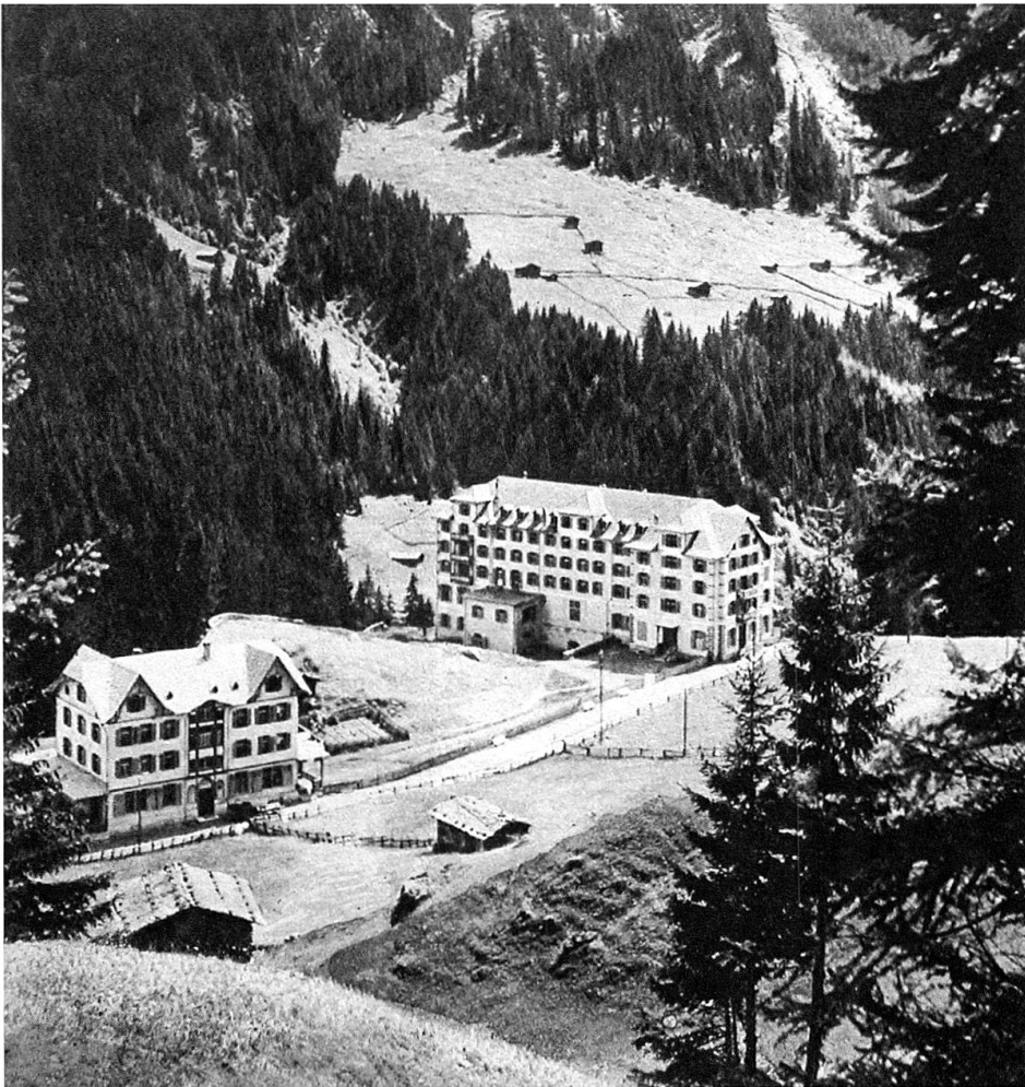
Ansicht der Waldhäuser (Grosses Waldhaus mit Dépendance), um 1914.