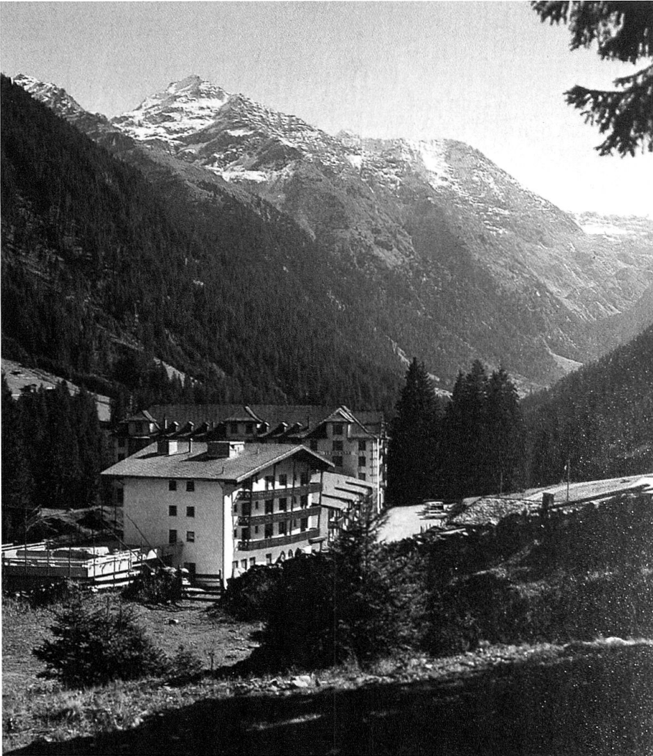
Tenigerbad, Neubau von 1971 mit Waldhaus im Hintergrund (Kantonsbibliothek Graubünden T 28.110).

1962 wurde die «Tenigerbad AG» mit Sitz in Chur gegründet, die im Somvixertal einen Hotelneubau plante. Hauptaktionär dieser neuen Gesellschaft war ab 1966 Ernst-Ludwig Schulz aus Frankfurt am Main. 93 Im Mai 1971 wurde mit den Bauarbeiten begonnen. Nachdem in einer ersten Phase projektiert gewesen war, die Dépendance auszubauen, 94 wurde diese nun abgerissen und durch einen Neubau des Architekten Albert Schoch mit 150 Betten und drei verschiedenen therapeutischen Bädern ersetzt: einem Freibad neben dem Kurhaus, einem offenen Terrassenbad im ersten Stock und einem Kurhallenbad. Alle Bäder waren mit Wasser aus der Mineralquelle versorgt und in unterschiedlicher Abstufung nach «neuesten medizinischen Erkenntnissen und balneologischen Gesichtspunkten» beheizt. 95 Im Therapietrakt fanden sich Arztzimmer, Nasszellen und Räume für therapeutische Gymnastik und das «Tenigerbad-Trimset». Als Kurarzt amtete Dr. Pius Tomaschett, unterstützt von seinem tschechischen Assisten-