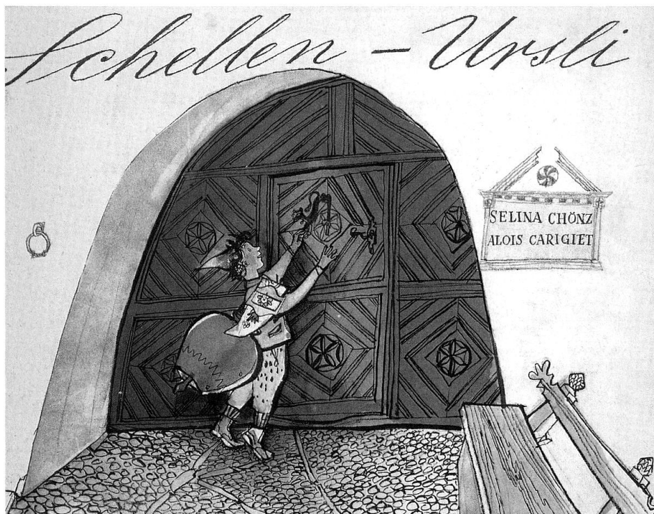
Das von Alois Carigiet gestaltete Titelbild zum «Schellen-Ursli» von Selina Chönz (Erstauflage Zürich, Schweizer Spiegel Verlag, 1949; die seit 1971 erschienenen Auflagen: Zürich, Orell Füssli Verlag).

Die suggestiven Bilderbücher, die farbigen Tafeln von Alois Carigiet und die Erzählungen von Selina Chönz, entstanden zuerst im Engadin. Von Skandinavien über Belgien bis Südafrika, von England über die Vereinigten Staaten bis Japan wurden die Bücher von Alois Carigiet/Selina Chönz verlegt. In «Uorsin», «Schellen-