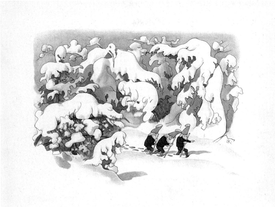
Abbildung aus «Ein Wintermärchen» von Ernst Kreidolf (Erstauflage München, Leipzig, Erlenbach b. Zürich, Rotapfelverlag, 1924).