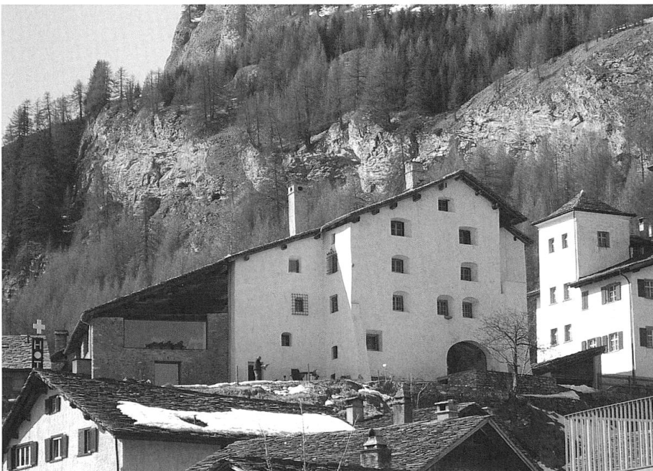
Wichtige Elemente des natur- und kulturnahen Tourismus sind traditionelle und historische Bauten. Das Hotel Weiss Kreuz in Splügen ist eine stilvolle Bleibe an der Via Spluga.

Der im Herbst 2007 vorgestellte Strategiebericht beleuchtete auch Beispiele aus Graubünden, die zeigen, dass natur- und kulturnaher Tourismus auch ökonomisch erfolgreich sein kann. Die Via Spluga , ein kulturhistorischer Weitwanderweg von Thusis nach Chiavenna, verzeichnet seit ihrer Eröffnung markant zunehmende Buchungszahlen. Der Umsatz konnte von 44 000 CHF im Jahr 2001 auf 431 000 CHF im Jahr 2005 bzw. 428 662 im Jahr 2007 gesteigert werden. 8 Dass touristische Angebote im Freien aber auch Schwankungen unterworfen sind und stark vom Wetter abhängen, zeigt der Rückgang im verregneten Sommer 2006 auf 320 000 Franken. Ein touristisches Angebot, das eng mit der regionalen Entwicklung gekoppelt ist, sind auch die Produkte des Scarnuz Grischun . Bäuerinnen bieten in Ge-