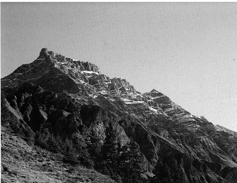
Der Piz Beverin mit seiner Naturlandschaft ist Namensgeber des Parkprojektes.

Eine frühere Studie war bereits zum Schluss gelangt, dass sich das Gebiet des Schamserbergs als Naturpark eignen würde. Neue Richtlinien des Bundes schufen aber neue Voraussetzungen: Ein regionaler Naturpark muss heute eine Mindestgrösse von 100 Quadratkilometern aufweisen und grundsätzlich ganze Gemeindegebiete umfassen. Um die nötige Parkfläche zu erreichen, erweiterte man den Parkperimeter um alle Gemeinden des Schams, des Safientals sowie um Tschappina und Sufers. Auch die neue, von der Fachstelle erarbeitete Studie kommt zum eindeutigen Schluss, dass ein «Regionaler Naturpark Beverin» machbar ist. Er würde den gesetzlichen Bestimmungen des Bundes entsprechen und wird gemäss Studie als Chance für die regionalökonomische Entwicklung dieses peripher-ländlichen Raumes betrachtet.