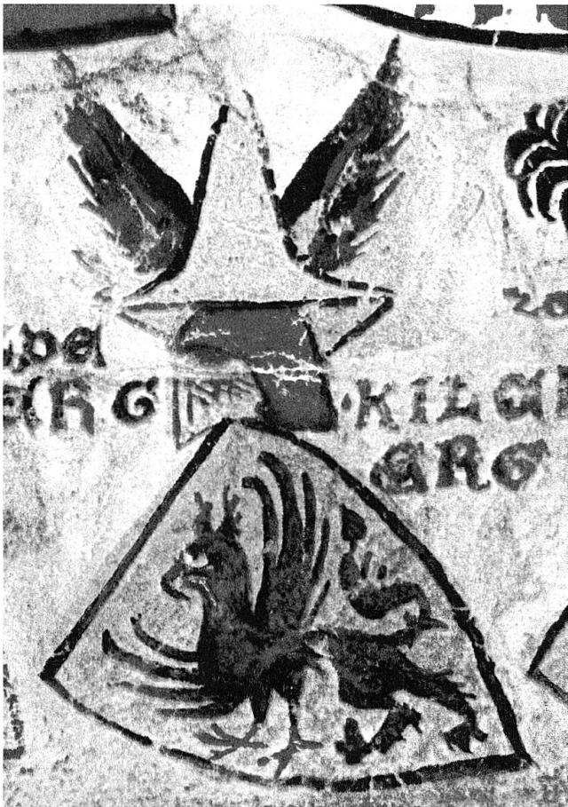
Wappen der Freiherren von Wildenberg, aus der Zürcher Wappenrolle: in gelb ein schwarzer Greif, rot bewehrt. Helmzier: ein Spitzhut mit zwei schwarzen Flügeln, in deren Mitte gelb-rote Eselsohren (!).

Haus Sagens um 1200 zunächst ein Zweig zu Greifenstein abspaltete, der später den Namen «von Wildenberg» annahm, während sich die Hauptlinie zu Sagens Mitte des 13. Jahrhunderts in zwei Äste zu Frauenberg und zu Fryberg teilte.» 27