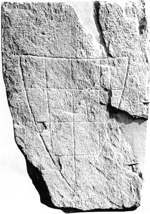
Grabplatte von der Sippengruft aus dem Bereich des Kreuzgangs, an der Südwand der Klosterkirche Churwalden. Der in Ritzzeichnung wiedergegebene Schild ist schachbrettartig geteilt, stellt also wohl das Vazer Wappen dar.

nischen Vorgängerbaus, der auf die Mitte des 13. Jahrhunderts oder in dessen ersten Hälfte zu datieren ist. 120 Weit vor die 1230er Jahre kann der ältere Bau aber nicht zurückgehen; der Bulle von 1222 ist er noch unbekannt. 121