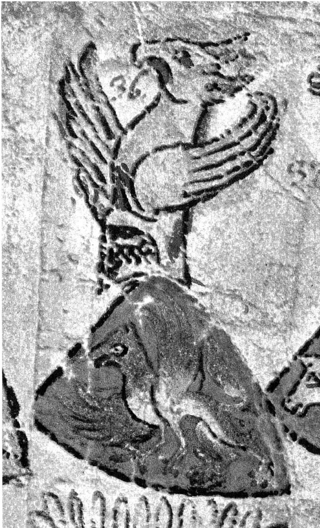
Wappen der Freiherren von Frauenberg, aus der Zürcher Wappenrolle: in blau ein steigender gelber Greif, rot bewehrt. Helmzier: der Greif wachsend.

Auch das Prämonstratenserkloster Rot an der Rot wurde vom letzten Wildenberger wieder bedacht: damit die dortigen Chorherren zu seinem Seelengedenken sangen, sollten ihnen Zinsen aus dem Lugnez zufließen. Schliesslich berücksichtigte das wildenbergische Vermächtnis die Prämonstratenserklöster St. Luzi bei Chur und Churwalden. 41