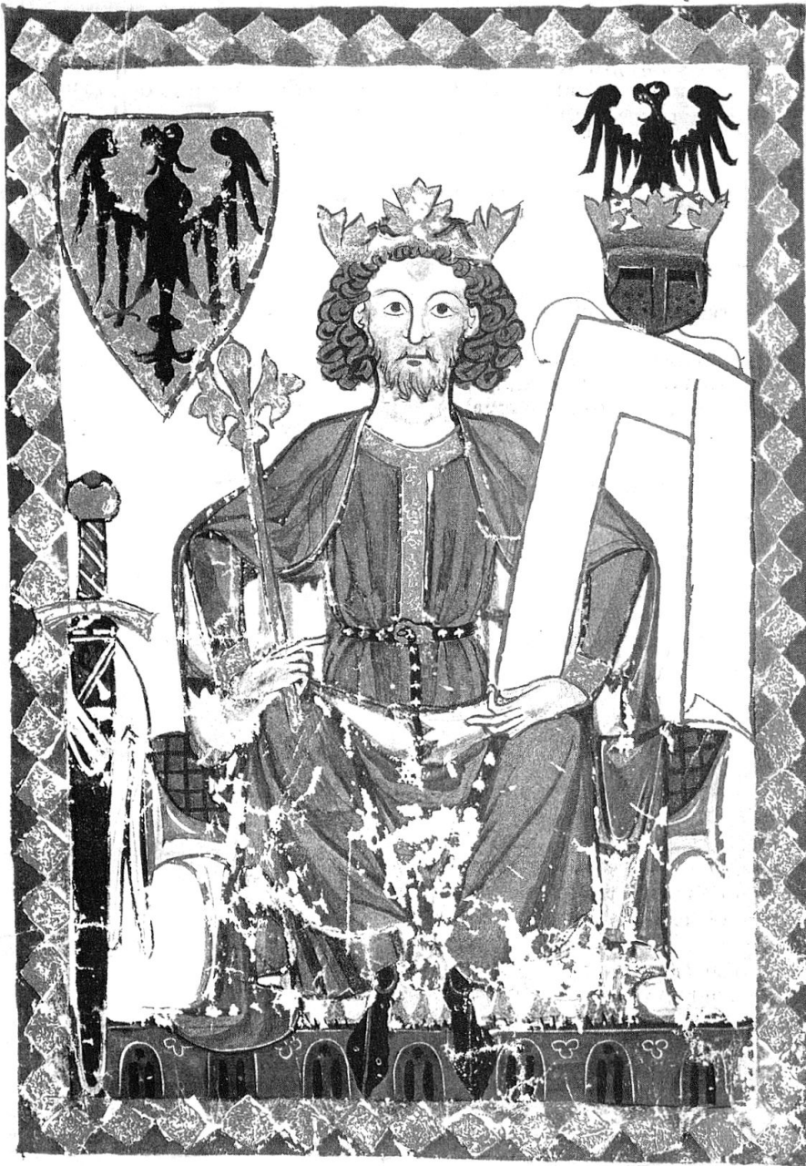
Kaiser Heinrich VI. als Welt-herrscher. Buchmalerei in der Manessischen Liederhand-schrift, zwischen 1305 und 1340 (Universitätsbibliothek Heidelberg). Auf dem Weg nach Sizilien hielt Heinrich VI. (1165–1197, Kaiser seit 1191) um den 22. Mai 1194 Hof in Chur.