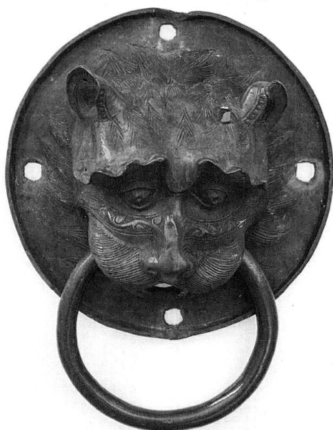
Einer von zwei Türziehern in Form einer Löwenmaske mit Ring, aus Churwalden. Nachziselierter Bronzeguss (Rätisches Museum Chur). Gemäss älterer (überholter?) Datierung stammt das Zuggriff-Paar aus der Zeit um 1200 und somit aus der doppeltürmigen Kirche St. Maria.

Dass die Vazer Familiengruft bei der zweiten Kirche angelegt, ja dass in Churwalden überhaupt eine zweite Kirche erstellt wurde, nachdem man doch schon eine bemerkenswerte Doppelturmkirche hatte: dies zeigt, dass man einen Neuanfang markieren wollte. Ab etwa 1230 wurde die Saxer Tradition in Churwalden bewusst durch eine vazische Bau- und Memorialkultur verdrängt. 125