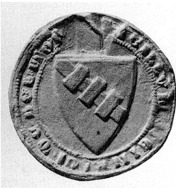
Siegel Heinrichs von Belmont, 1281 (Bischöfliches Archiv Chur). Das Wappenbild besteht aus einem Steigbalken mit drei Sprossen.

Ein Altar der Pleif-Kirche war dem hl. Konrad von Konstanz geweiht; dabei war dieser in der Diözese Chur ein seltener Titelheiliger. 20 In der Kathedrale, immerhin, hatte er einen weiteren Altar: hinter der Gruft der Herren von Belmont, gestiftet durch dieselben 1282, nach dem Tod ihres Angehörigen, des Bischofs Konrad III. Die Gebrüder Konrad und Heinrich von Belmont waren mit Konrad Pfefferkorn, dem Generalvikar von Konstanz, befreundet. 21