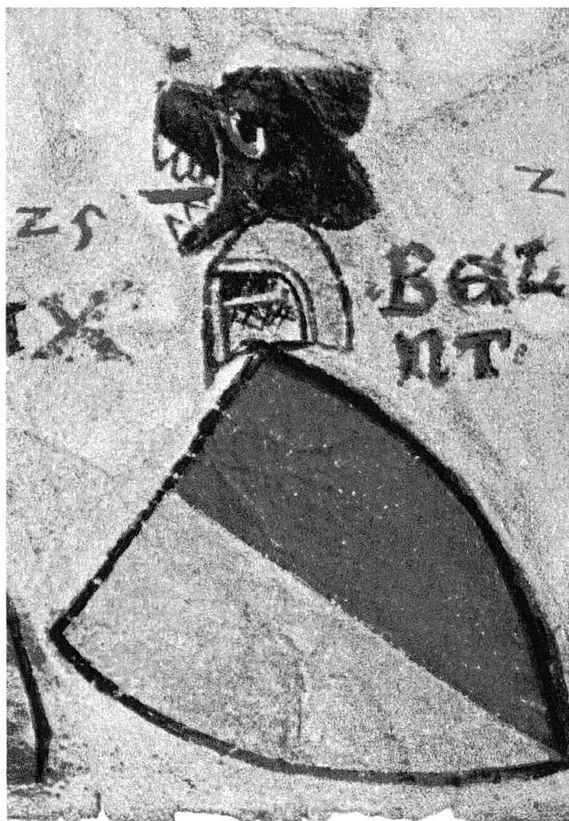
Wappen der Freiherren von Sax, aus der Zürcher Wappenrolle: Schild gespalten von gelb und rot. Helmzier: schwarzer Bärenkopf mit roter Zunge. (Das Wappen der Linie Sax-Misox zeigt ab dem späten 13. Jh. ausserdem zwei Säcke.)

Die Bedeutung dieses Schrittes ist nicht zu unterschätzen: Krankenpflege gehörte zu den zentralen Aufgaben der Prämonstratenser. So wird das Churwaldner Filialkloster St. Jakob (Klosters) im frühen 14. Jahrhundert geradezu als «Kloster oder Spital im Wald» bezeichnet. 106 Bei der Saxer Stiftung von 1210 machen «die in einem eher dominanten Ton gehaltene Stiftungsurkunde und der Umfang der Bestimmungen» insgesamt den Eindruck, «dass in Churwalden die Sax und nicht die Vaz bestimmten». 107