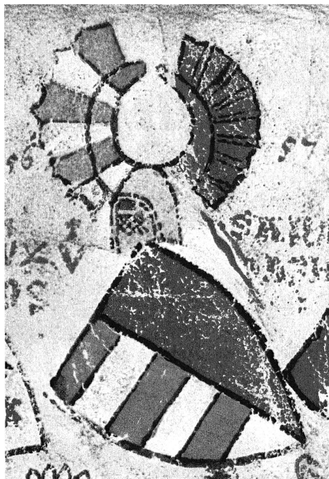
Wappen der Freiherren von Vaz und der Freiherren von Rhäzüns. Aus der Wappenrolle von Zürich, der ältesten und grössten Wappensammlung des deutschen Reichs, um 1340 (Schweizerisches Landesmuseum Zürich).

die Tarasper ihren Besitz, insbesondere im Oberhalbstein, ebenfalls dem Churer Oberhirten (1160). 9 Ihre Erben im Unterengadin und Vinschgau waren die Freiherren von Matsch. 10