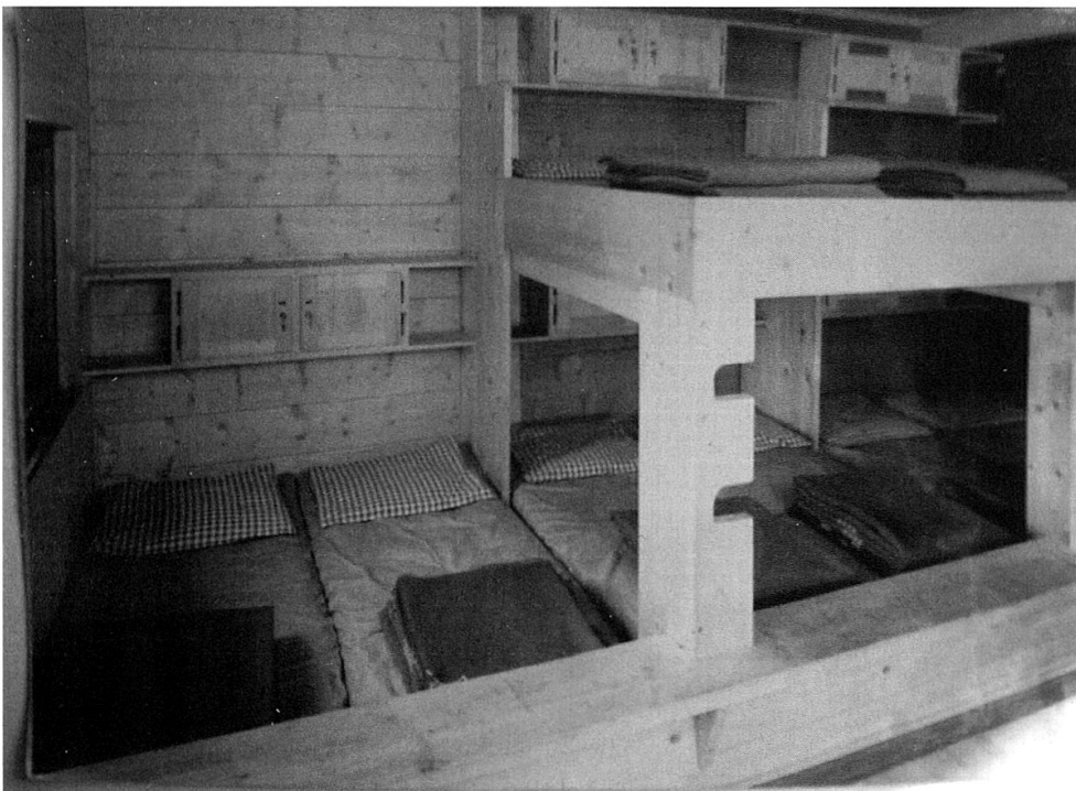
Speisesaal und Massenlager in ursprünglicher Holzmöbi- lierung.