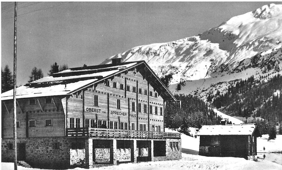
Das «Oberst von Sprecher-Haus» im Eröffnungsjahr 1934, rechts das 1967 abgebrochene Gufer-Haus.

Der Kulturgüterschutz scheint in den Berner Armeeamtsstuben eine eher untergeordnete Bedeutung zu geniessen. Es ist in hohem Masse zu bedauern, dass im Rahmen der konzeptionellen und baulichen Neugestaltung der Luziensteig zu Beginn der 1990er- Jahre das «Generalstabschef Sprecher-Haus», ein als Soldatenstube dienendes Kulturgut aus dem Ersten Weltkrieg, in aller Stille niedergerissen wurde – ohne die Möglichkeit eines Rückbaus und eine Errichtung an anderer Stelle auch nur zu erwägen. Lediglich ein paar Ansichtskarten erinnern noch an die Innen- und Aussensicht dieses Gebäudes, welches als Anerkennung für die seit 1905 gegenüber der Armee und dem Land geleisteten Dienste den Namen des Generalstabschefs trug. Verschwunden ist neben dem Mobiliar auch wertvolles Interieur wie Kunstglasscheiben. Errichtet wurde das markante Gebäude im Zentrum der alten Festung im Verlaufe des letzten Kriegsjahres 1918 durch den Winterthurer Architekten André Bridler (1864–1938), dieser war während der Kriegsjahre als Unterstabschef im Range eines Oberstdivisionärs ein enger Mitarbeiter von Generalstabschef Theophil Sprecher von Bernegg (1850–1927). Im Frühjahr 1919 war Bridler im Gespräch als Nachfolger seines