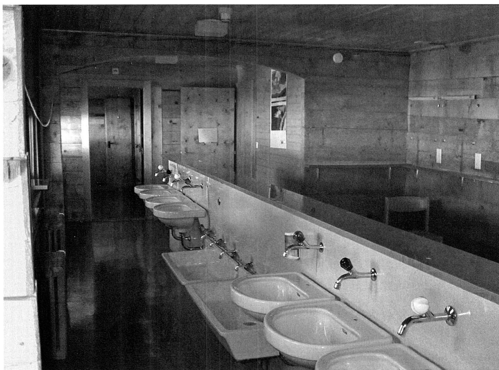
Waschraum mit zeitgenössischer sanitärer Einrichtung.

senschaftsmitgliedern bzw. Verbandsmitgliedern zur Verfügung zu stellen. Die Aufnahme auch von Drittpersonen (Passanten) müsste als Übertretung des Bundesgesetzes (Bundesbeschluss über die Erstellung und Erweiterung von Gasthöfen) betrachtet und strafrechtlich verfolgt werden.