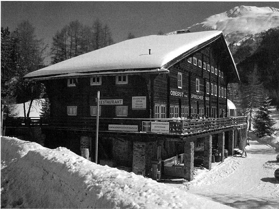
Das «Oberst von Sprecher-Haus» im Winter 2009/10.

dieses erhaltenswerten Kulturobjekts, nicht untypisch für die damaligen Hochkonjunkturjahre, in welchen der kräftig pulsierende unternehmerische Geist der Gegenwart oft das ideelle Motiv der Erhaltung der baulichen Vergangenheit verdrängte.