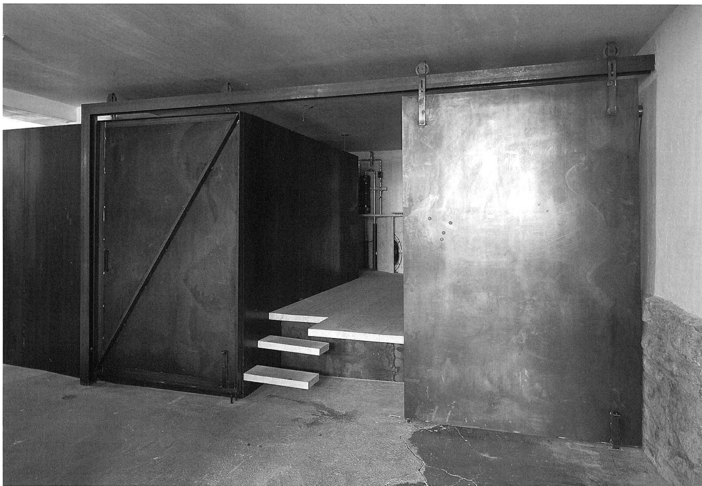
Der Raum des Filmvorführers.

Dann findet man das Haus Vieli im Zentrum des Städtchens. Ein stattliches Haus mit Stil, einst unverkennbar von Rudolf Olgiati umgebaut, mit Wohnungen, Büros, einem Therapieraum und einem Café. Und mit Besitzern, die Kultur fördern. Seit Herbst 2004 vermieten sie dem Filmclub den rückseitigen Anbau, Räume und Keller im Haupthaus. In dieser ehemaligen Weinhandlung, die vielleicht auch mal als Schmiede genutzt wurde, findet in den folgenden Jahren ein vielseitiges Winterprogramm seinen Ort – mit Veranstaltungen auch für Kinder, Jugendliche und Senioren, für Einheimische und Weltoffene, auf Plastikstühlen und mit gemütlichem Barbetrieb danach. Die grosse Nachfrage gab den Initianten Recht. Und machte ihnen Mut zu mehr.