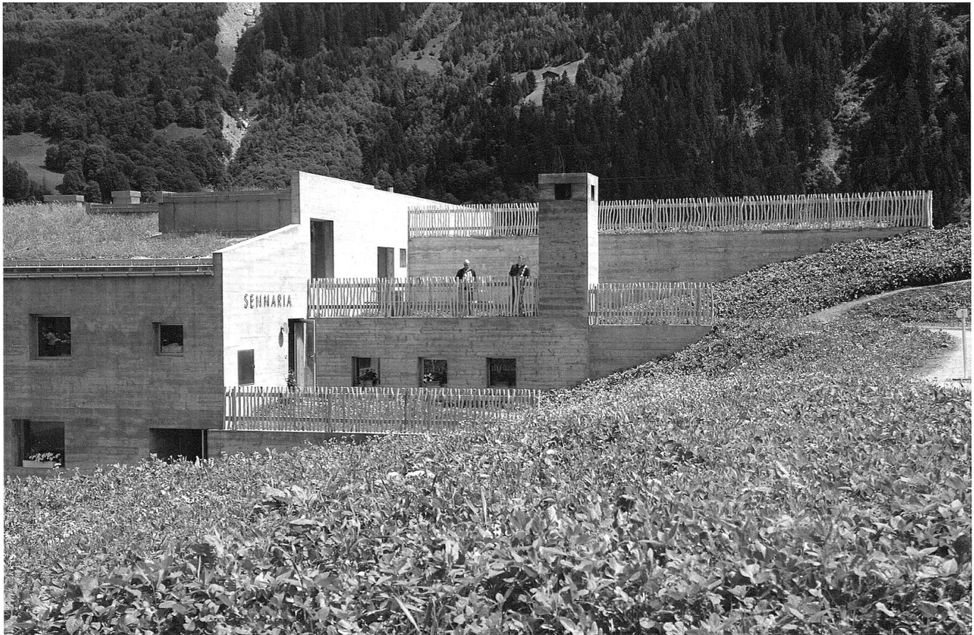
Die Sennerei in Disentis von Gion A. Caminada, 2010.

Die Führungen beginnen in einem Raum, der für gesellschaftliche oder schulische Anlässe rund um die Landwirtschaft konzipiert ist. Der Raum ist gewissermassen das Herzstück des Center Sur-silvan d'Agricoltura , wo Veranstaltungen und Diskussionen rund um Themen wie das Zusammenspiel von Kloster, Bildung, besonders aber Landwirtschaft und Tourismus stattfinden können. 4 Danach geht es auf den Rundgang, die Treppe hinunter zur Ebene mit dem Vieh, wo man zuerst die Melkmaschine passiert. Das ist ein spezieller Ort, schliesslich handelt es sich hier auch um einen Milchbetrieb. Entsprechend wichtig ist der Melkakt. Denn fühlten sich die Kühe beim Melken nicht wohl, so Bauer Scheuber, gäben sie weniger Milch. Entsprechend war das Installieren der Melkanlage eine aufwändige Angelegenheit, bei der sorgsam darauf geachtet wurde, dass die Metallteile der Anlage an keiner Stelle und in keiner noch so geringen Menge Strom leiten, während sie in Betrieb sind. Führten Teile dennoch Strom, wurden sie isoliert. Heute ist Scheuber zufrieden, den Kühen sei es in der Anlage wohl, sie gäben hervorragende Milch. Weiter geht es an einem Zuchtstier vorbei – letztendlich soll dieser die hier täglich vorbei ziehenden Kühe beschnuppern, will man doch auch fürs nächste Jahr viele gesunde Kälbchen.