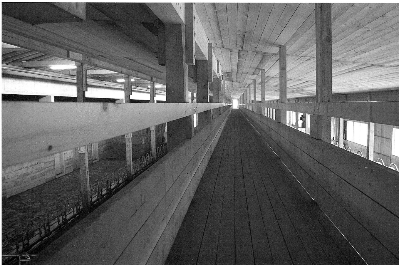
Der öffentlich zugängliche Besuchersteg unter dem Dach des Klosterstalls.

40 Prozent gesunken. Das sind markante Zahlen für eine Region, die um ihre Eigenständigkeit kämpft.