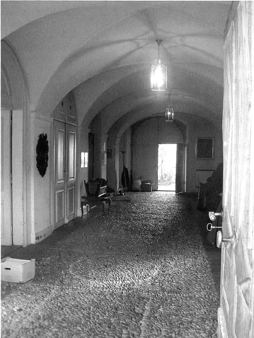
Der Durchgang, wo die Kutschen einst einfuhren. Die Pferde wurden von hier durch die hintere Flügel-tür in die Stallungen geführt.

empor, um über den schmalen Weg zwischen Eiskeller und Bongert auf dem Platz zu landen. Dann fuhr man nicht «vor» sondern «ein». Nicht nur die beiden grossen Flügeltüren der Haustüre, sondern auch die abgerundeten Oberflügel waren mit einer besonderen Stange geöffnet worden, und man fuhr in den gepflasterten Durchgang, um an der breiten Steintreppe, die dort landet, zu halten. Da stund, durch das scharfe Getrappel, das durch das ganze Haus hallte, denn es gehörte dazu, im Trab einzufahren, Grossmama mit ihrem schwarzen Spitzenhäubchen und half bewillkommend beim Aussteigen. Wir aber durften noch zusehen, wie die Türen gegen den hinteren Garten geöffnet wurden und Christian hinaus und in die Remise kutscherte.