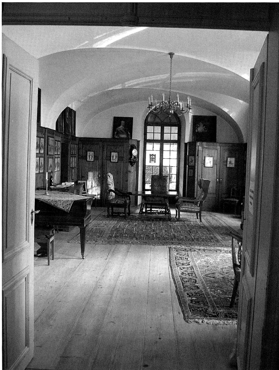
Blick in den Salon, reich dekoriert mit einer Ahnengalerie. Hier finden sich auch die Porträts von Jürg Jenatsch und Pompejus von Planta.