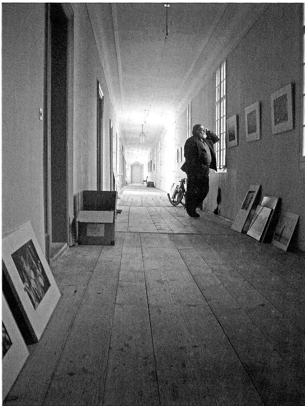
Die lange Galerie des Seitenflügels, das Spielparadies der Kinder im 19. Jahrhundert.

Vorhangsstangen, an Gurten von der Decke herabhängenden Matratzen und Nachttischchen auch zwei schöne Empiremöbel aus Mahagoni und Bronze, die später wieder zu Ehren gezogen wurden.