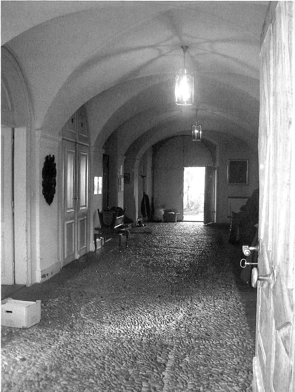
Der Durchgang, wo die Kutschen einst einfuhren. Die Pferde wurden von hier durch die hintere Flügeltür in die Stallungen geführt.