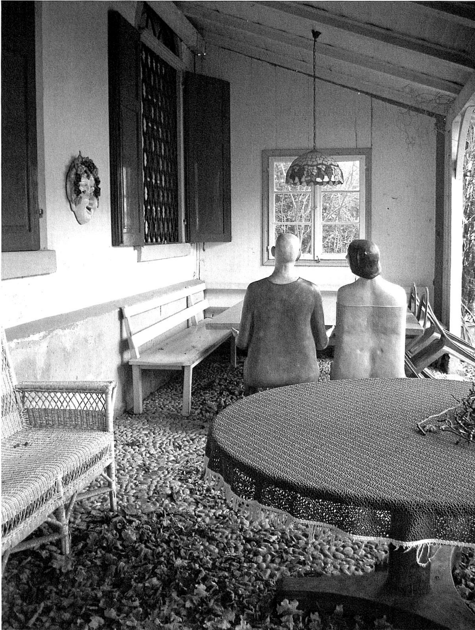
Sitzplatz mit Blick auf den Rhein.

mit eigrossen Kugelsteinen gepflastert ist, denen eingelegte, weisse Kreise einen gewissen Schmuck verleihen. Das Fenster hatte, im Geschmack der Mitte des vorigen Jahrhunderts, farbige Scheiben. Während im Laufe der Jahre die meisten durch weisses Fensterglas ersetzt wurden, hielt sich lange noch ein grosses, dunkelblaues Viereck, das sich meiner besonderen Anhänglichkeit erfreute. Rechts war an der Wand der niedere, grüngestrichene Kindertisch mit entsprechenden Stühlen, daneben, gegen den Garten hin und zwischen Ranken einer wilden Rebe, die Schaukel. Sicherheitshalber war sie rings von mittelst Kugeln an den Seilen verschiebbaren Stäben umgeben. Wie oft haben wir da, Hans und Elsi Schwerzenbach, die Reichenauer Cousins, Tilly und Adolf etc. «wild» ge-