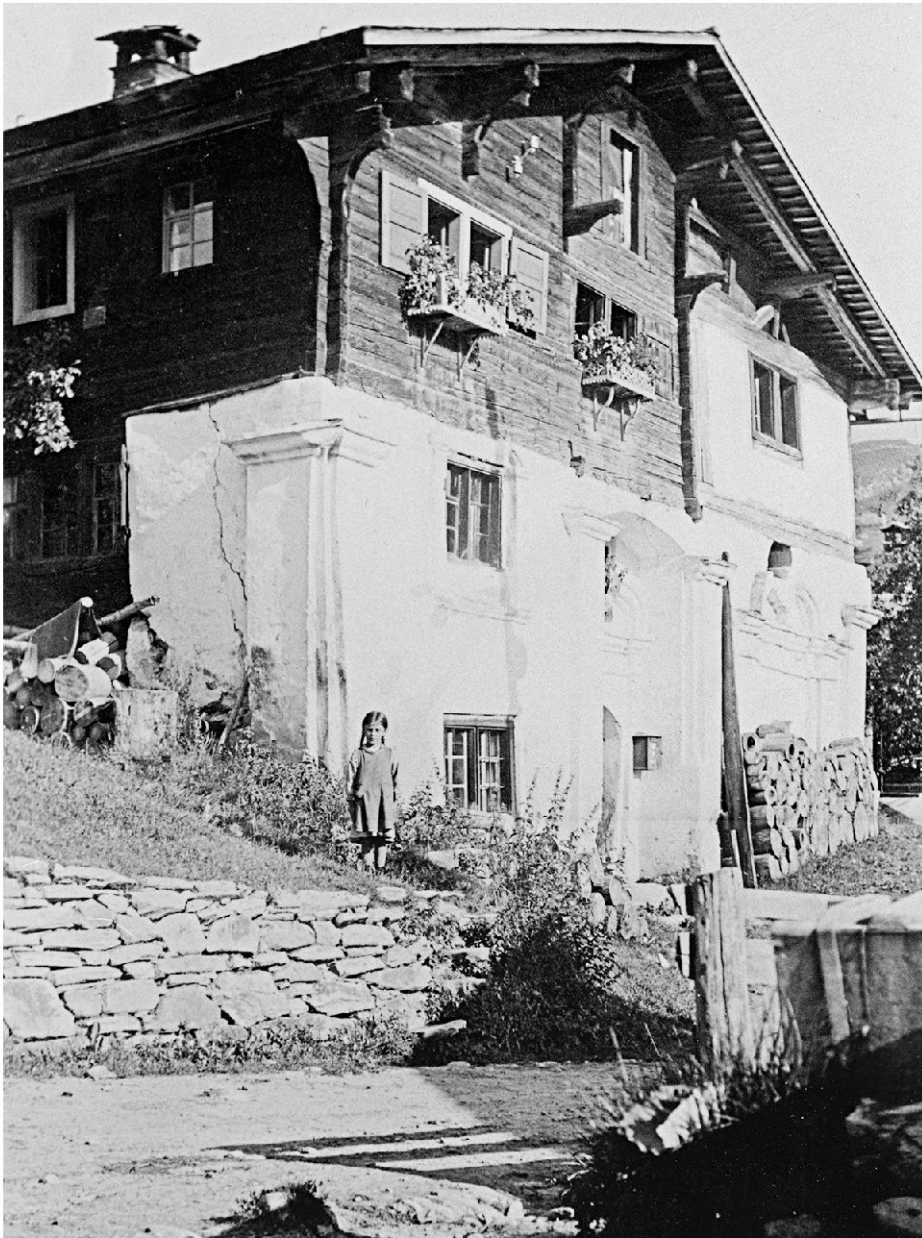
Ansicht des Hauses ca. in den 1930er-Jahren. Die hölzernen Aufbauten sind noch unverputzt und mit Würfelriesen und Eselsrücken verziert. An der Südostecke ist ein schadhafte Pilasterkapitell erkennbar.

Den Kapellenraum in der nördlichen Haushälfte, dessen Apsis gegen Westen halbrund abschliesst, betritt man vom ebenerdigen Mittelkorridor des Hauses her. Auffällig ist im Innern die Strukturierung der verputzten Wände durch Wandpfeiler und dazwischen eingeschriebene Segmentbogenfelder sowie nord- und süd-