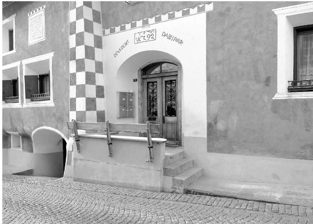
Engadinerhaus in Samedan, datiert 1792 (Foto: Urs Meister).

ren, hat sich heute zunehmend eine Haltung etablieren können, die man als organisch bezeichnen kann.