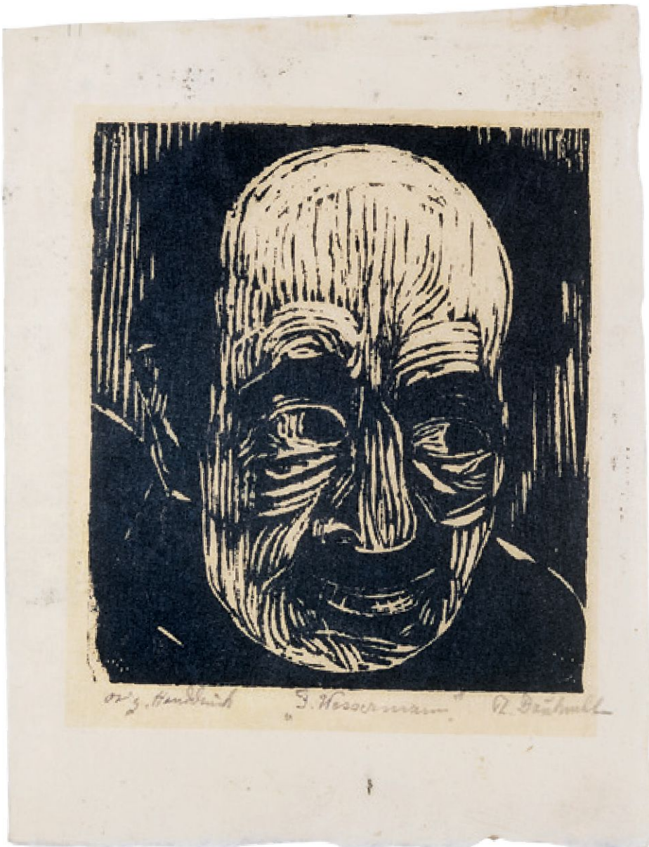
Philipp Bauknecht, Porträt Jakob Wassermann , Holzschnitt (Galerie Iris Wazzau, Davos).