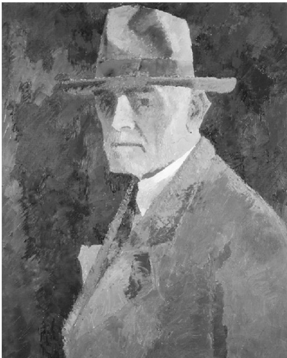
Augusto Giacometti, Selbstportait.