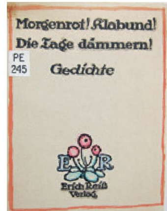
Erwin Poeschels Exemplar des Gedichtbandes Morgenrot! Klabund! Die Tage dämmern!

Die Anspielungen auf den anderswo tobenden Weltkrieg und den Frieden in der Davoser Höhenlage sind deutlich.