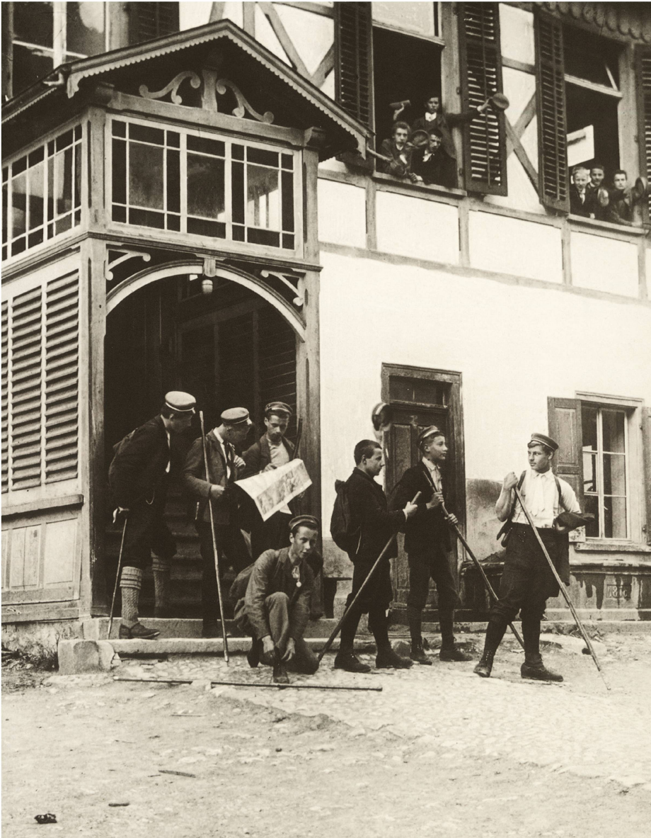
Ältere Schüler der Evangelischen Lehranstalt Schiers beim Aufbrechen.

die Landesgrenze emporgrüsst. Das Gebiet ist völlig ungefährlich für jeden, der nicht mutwillig abseits vom Wege die Gefahr sucht, aus jahrzehntealter Tradition allen Bergfrohnen unter unseren älteren Schülern wohl bekannt, zu herrlichen Tagestouren von Schiers aus gerade gross genug, und abgesehen von einzelnen Verspätungen hatten wir nie Veranlassung, ihnen zu solchen eintägigen Bergfahrten im Sommer Lehrerbegleitung mitzugeben.»