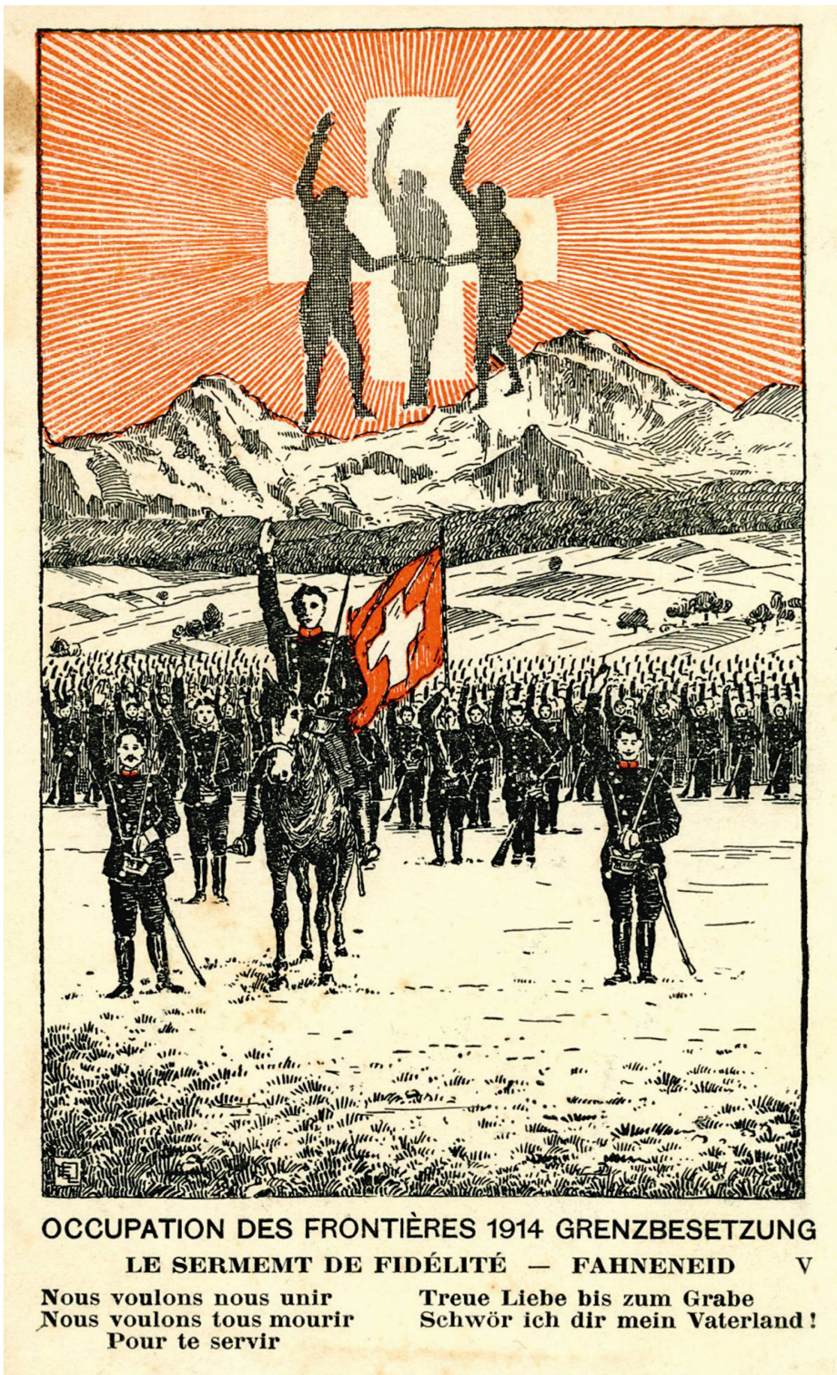
Grenzbesetzung 1914: Unter dem Zeichen der alten Eidgenossen schworen die Schweizer Truppen ihre Treue (Privatsammlung M. Veraguth, Chur).

trächtigen Gruppe, ja man kann sagen, man betrachtet sich als eine einzige grosse Familie, in der alles zum Wohle der Gesamtheit zusammen arbeitet.» 43