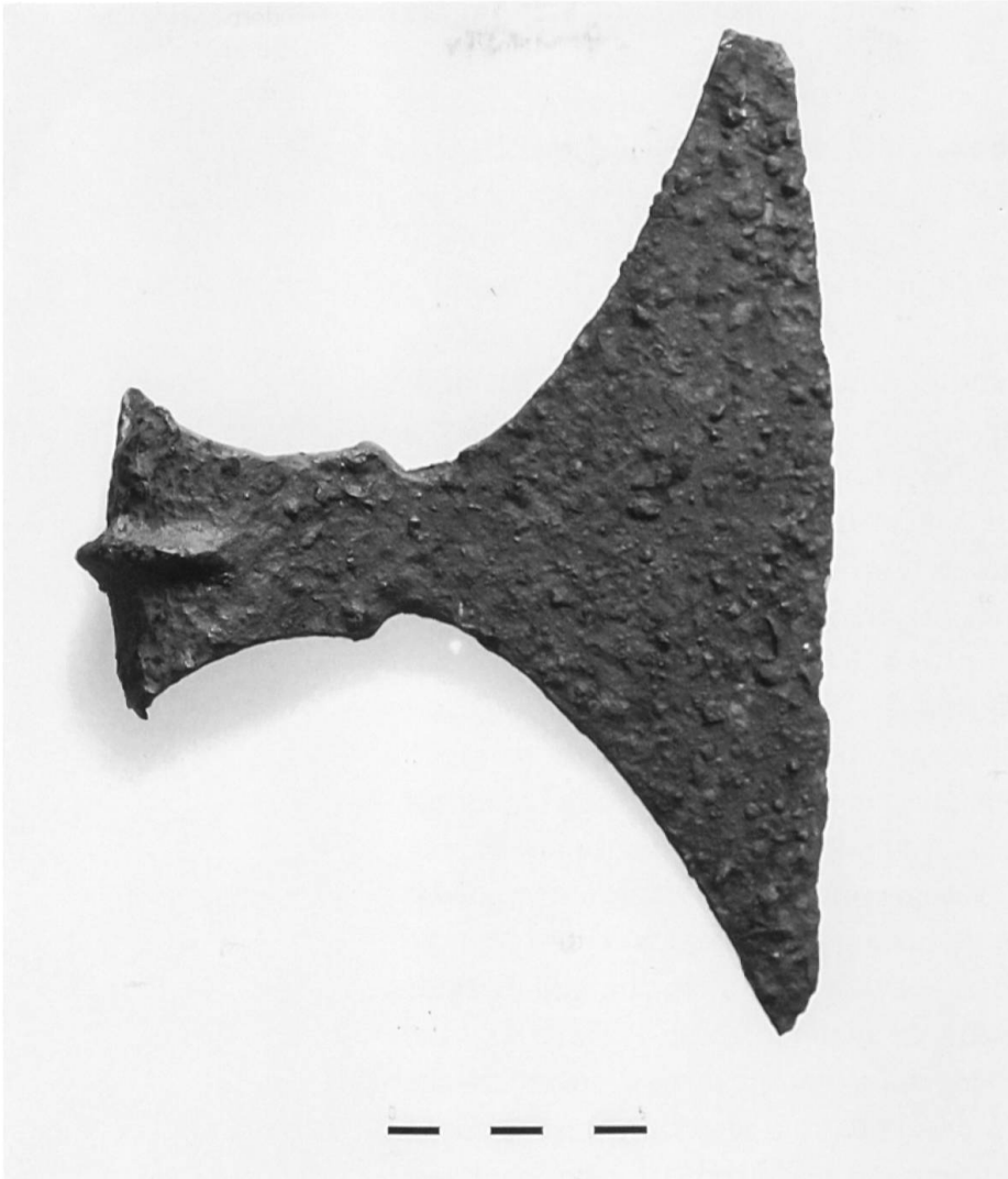
Bivio, Septimerpass, eiserne Hellebardenaxt.

über 30 Schleuderbleie mit Legionsstempeln. Ich begleitete den Sondengänger mehrere Male im Gelände und gab ihm exakte Instruktionen zur Funddokumentation und fand selbst auch mehrere Schleuderbleie und weitere römische Metallobjekte.