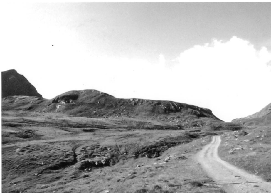
Bivio, Septimerpass, Hochplateau, auf dem sich die Funde des frühromischen Lagerplatzes fanden.

wertlos wären. Erfreulicherweise leistete der Vorarlberger meiner Aufforderung Folge und kam zusammen mit einem Münchner Archäologen und mir auf den Septimerpass und zeigte uns, wo er den Fund geborgen hatte. Da sich die meisten Funde auf eine Fläche von rund 50–60 m 2 konzentrierten, nahm ich zunächst an, dass es sich bei der Fundstelle um eine Art Weihedepot handeln könnte, was sich später allerdings als falsch erwies.