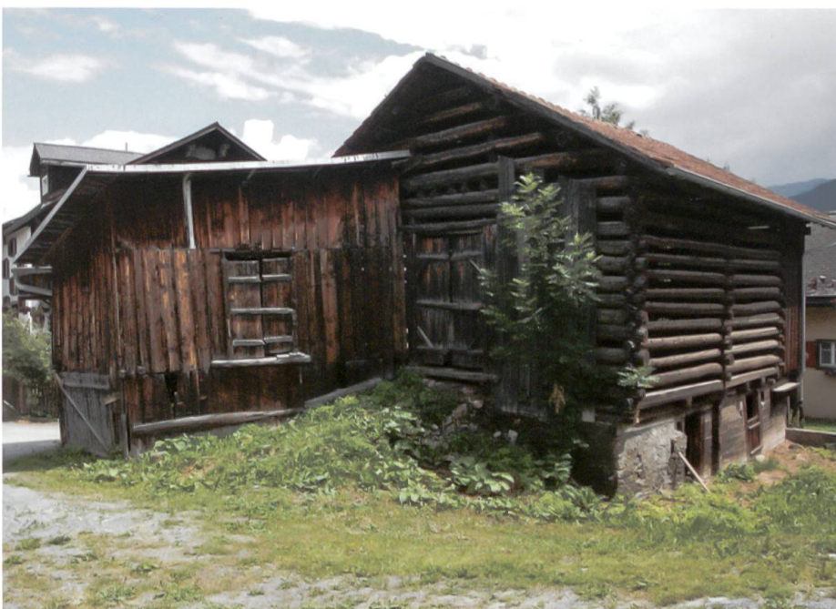
Leer stehende Stallscheune mit angebautem Schopf, ein ortsbildprägendes Objekt am östlichen Dorfrand von Vignogn.

Seit Januar dieses Jahres ist das Zweitwohnungsgesetz in Kraft. Dieses sieht vor, dass in Gemeinden mit einem Zweitwohnungsanteil von über 20 Prozent sogenannte «ortsbildprägende Bauten» innerhalb der Bauzone zu Ferienzwecken umgenutzt werden können, wenn keine andere Möglichkeit für ihre Erhaltung besteht. Als «ortsbildprägend» gelten Gebäude, «die durch ihre Lage und Gestalt wesentlich zur erhaltenswerten Qualität des Ortsbildes und zur Identität des Ortes beitragen». Bauwerke also mit (möglicherweise) bescheidenem Eigenwert, denen im Rahmen eines Ensembles aber grosse Bedeutung beigemessen wird. In unseren Dorfkernen gehören dazu potentiell alle in ihrer ursprünglichen Erscheinung noch intakten historischen Gebäude – mithin auch die alten Stallscheunen, die man in praktisch jeder Bündner Ortschaft in einer Vielzahl antrifft. Durch den Strukturwandel in der Landwirtschaft ihrer ursprünglichen Funktion entledigt, stehen sie heute brach und scheinbar unnütz da. Nun bieten sie bauwilligen Feriengästen eine Möglichkeit, ihren Traum vom eigenen Ferienhaus trotz Zweitwohnungsbaustopp doch noch zu erfüllen.