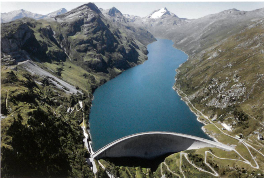
Der gefüllte See mit dem Pizzo Stella im Hintergrund. Der Stausee ist ein beliebtes touristisches Ausflugsziel.

Der Stausee Valle di Lei liegt auf italienischem Staatsgebiet, das Wasser wird aber auf Schweizer Seite in den Zentralen Ferrera, Bärenburg und Sils im Domleschg genutzt. Ähnlich verhält es sich beim Lago di Livigno der Engadiner Kraftwerke. Der Speicher liegt in Italien, das Wasser wird aber in den Turbinen der Zentralen Ova Spin bei Zernez und Pradella unterhalb Scuol verstromt. Der Unterschied besteht darin, dass bei den Kraftwerken Hinterrhein die italienische Edison S.p.A. mit 20 Prozent beteiligt ist, bei den Engadiner Kraftwerken verfügt der italienische Nachbar hingegen über keine Beteiligung. Italien hat dafür aber das