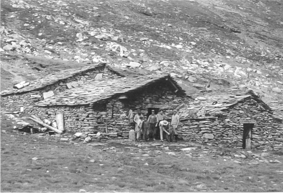
Motalla war eine der umstrittenen Alpen, für die man vergeblich Realersatz suchte.

bündnerischem Gebiet zur Verfügung stellen zu können. Zum Unterhändler bestimmte der Kleine Rat im November 1947 den Bergeller Bezirkstierarzt Pierin Ratti, der vor einer komplizierten Aufgabe stand. Dem Kauf der Alpen in der Valle di Lei stand ein italienisches Gesetz von 1942 im Weg, das Ausländern den Erwerb von Grund und Boden sowie von Immobilien verbot. Zudem wollten die Besitzer grösstenteils kein Geld, weder Franken noch Lire, sondern Realersatz in Alpen und Weiden. Für Ratti war klar, dass erst die «befriedigende Lösung des Realersatzes jede Opposition gegen den Stausee beseitigen würde...». 21 Erschwerend für die Verhandlungen war die grosse Zahl von Alpbesitzern, mit denen es Ratti zu tun hatte. 22 Zudem bildete sich eine «lokal-patriotische Bewegung für die Erhaltung der Valle di Lei». Ratti versuchte sein Glück schliesslich in einem «bilateralen Weg», indem er Kontakt mit den Besitzern aufnahm und gleichzeitig ein Konzessionsgesuch ans Ministerium in Rom richtete.