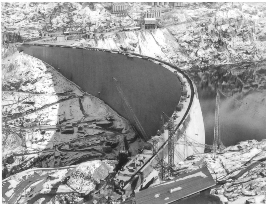
Die Staumauer kurz vor der Fertigstellung. Dank rasant fortschreitender Mechanisierung der Beton- und Kieszubereitung, der Verwendung von Kabelkranen und dem Ausbau der Transportwege gingen die Arbeiten sehr schnell voran.

chen, wobei die Staumöglichkeiten im Aversertal und besonders jene in der Valle di Lei als Ersatzmöglichkeiten in den Vordergrund treten, letzter käme allerdings auf italienisches Gebiet zu liegen. Die Staumauer könnte mit italienischer Arbeit und italienischem Material bedeutend billiger erstellt werden als die Mauer bei Splügen; es würden keine Umsiedlungskosten entstehen und ferner würde die Stauung etwa 400 m höher oben als im Rheinwald erfolgen. Im Sommer könnte auch Hinterrhein-Wasser durch den Stollen vom Stausee Sufers nach Innerferrera geleitet und in den Stausee Valle di Lei gepumpt werden.» 13