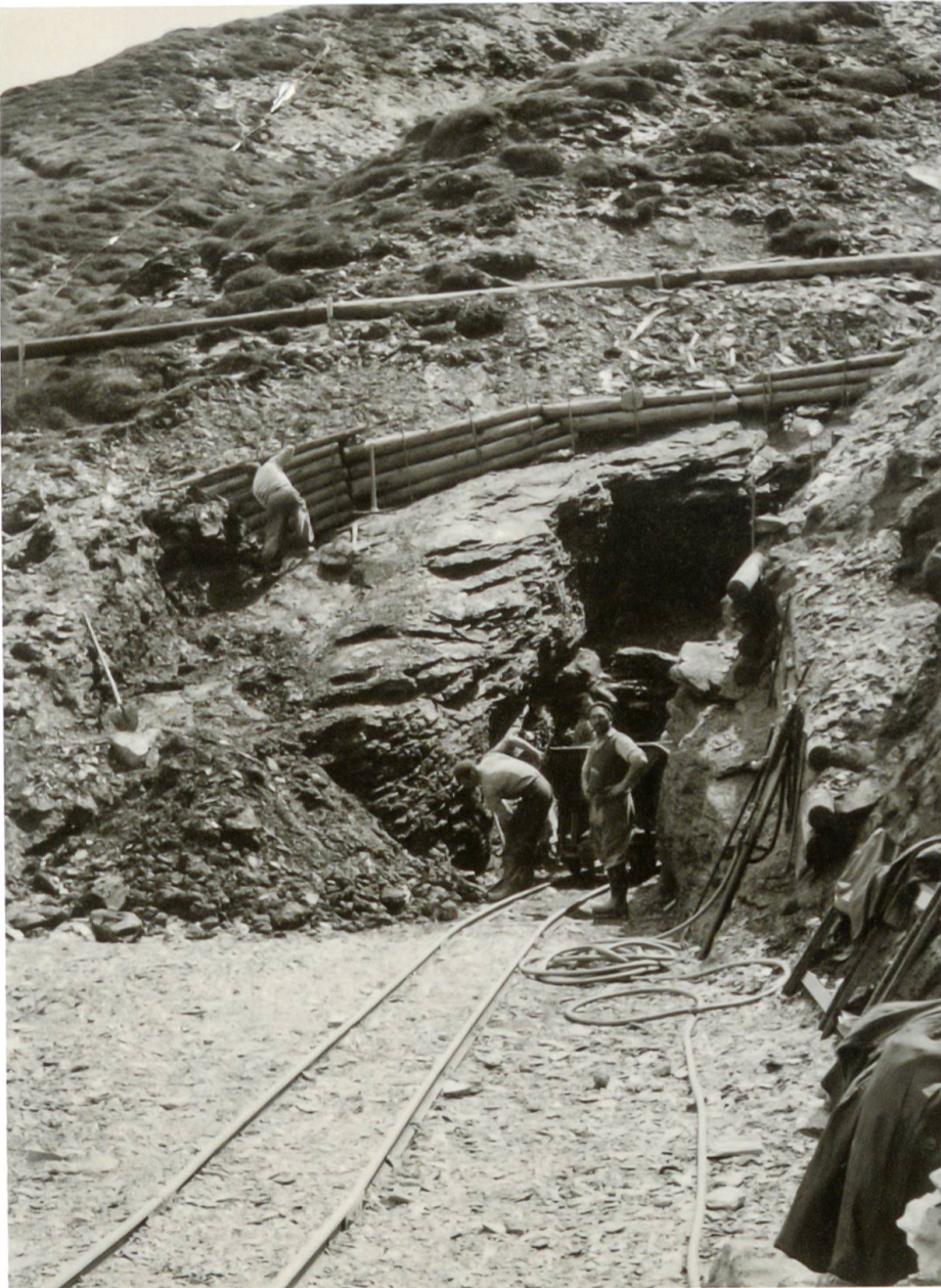
Voreinschnitt des Freispiegelstollens nach Madris. Hier wurden die beiden Munggenkätzchen gefunden.

ausgewachsenen Tiere waren erschrocken erwacht und geflohen und zwei Junge blieben liegen. Ohne Hilfe wären sie gestorben. Da hatte ich sie nun in den Armen. Ich legte sie in einen Korb in der Küche und sie erwachten langsam. Wieder war nun unser bewährter Zimmermann gefragt. Er erstellte im Gärtchen ein nach oben zugedektes und so vor Raubvögeln sicheres Gehege. So entstand aus einer Munitionskiste ein bescheidenes Hüttchen für die Tiere.