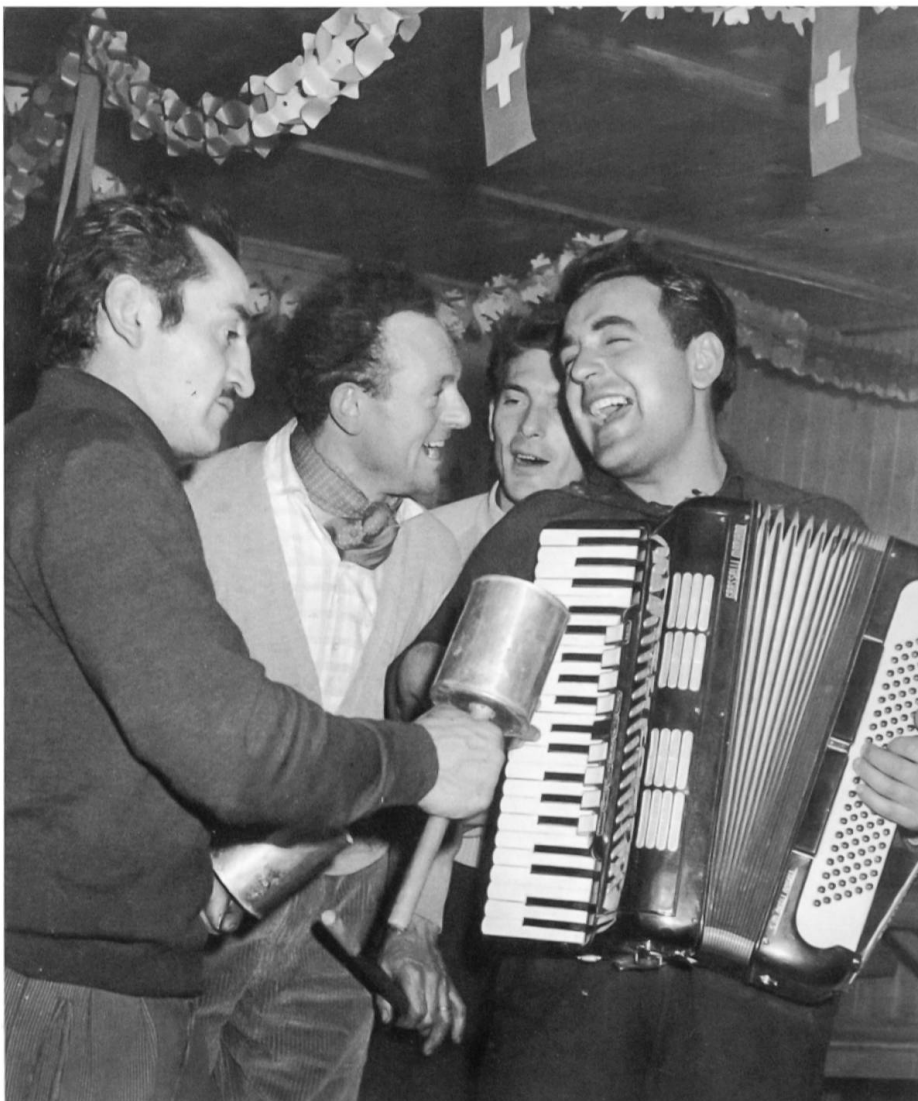
Nach dem Durchschlag: Ausgelassenes Feiern in der Kantine.