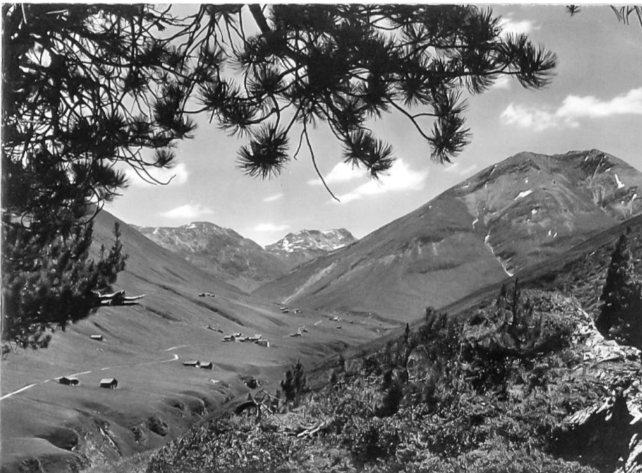
Blick ins Avers.

Über 100 italienische Arbeiter, meist aus dem Veltlin und aus Belluno, bewohnten das Barackendorf. Zwei lange Schlafbaracken mit Kajütenbetten und je einer Küchen- und Kantinenbaracke machten das «Dorf» aus. Die Essbaracke war in zwei Räume auf-