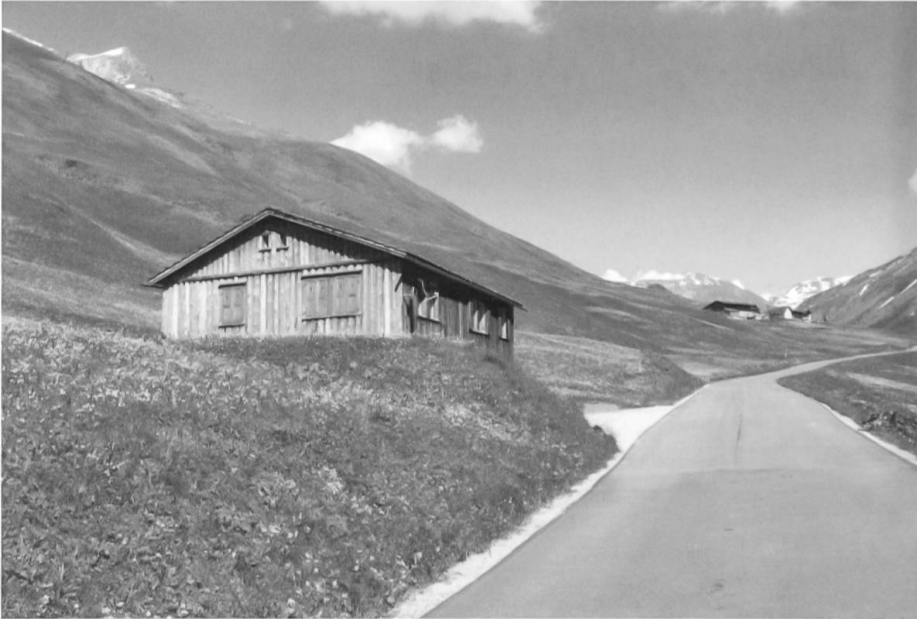
Wohnbaracke Husmann im Jahr 2012 (Foto: Christian Patt).

geteilt, einen grossen Esssaal für die Arbeiter und einen kleineren für die Vorgesetzten.