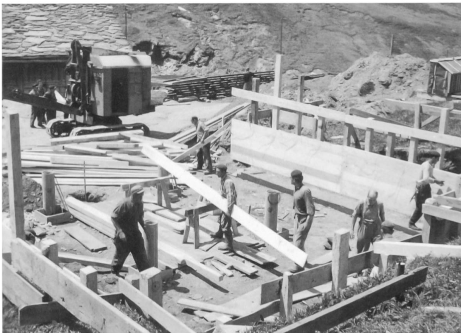
Unsere Wohnbaracke im Bau.