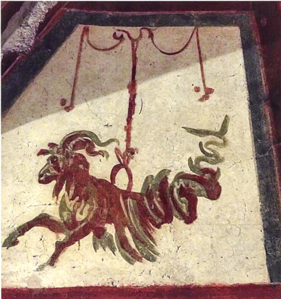
Steinbock als Dekorationselement in der «stanzella dell'Orante» der Case Romane in Rom, 4. Jahrhundert n. Chr.

Mit der Übernahme des ursprünglich zum Tierkreiszeichen gehörigen Motivs von der besonderen Affinität des Steinbocks zur Kälte in die Beschreibung des real existierenden Tieres korrespondiert die sowohl von Conrad Gessner als auch Durich Chiampell bezeugte Bedeutungsverschiebung des Terminus capricor-