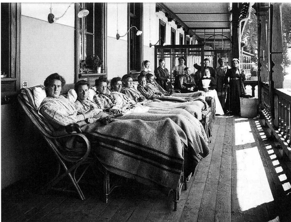
Liegekur in einem Davoser Sanatorium um 1900. Stilles Liegen, Bergluft, Sonne und Diät wurden lungenkranken PatientInnen als heilsame Kur verschrieben.

Das berühmteste literarische Zeugnis der Davoser Kurära ist Thomas Manns (1875–1955) Roman «Der Zauberberg» (1924). Die Beschreibung der Luft weicht hier durchaus ab von dem literarischen Diskurs, der im vorherigen Kapitel dieses Aufsatzes behandelt wurde. Die Alpenluft befreit zwar vom «unbewussten Gefühl organischer Lebenslast [...], da das Atmen der leeren, nichtig-dunstlosen Luft dem Organismus nicht schwerer fiel als das Nichtatmen den Toten.» 52 Diese Befreiung wird aber durch die eher negativ konnotierten Adjektive «leer» und «nichtig» und durch den Vergleich mit dem Toten in ein ambivalentes Licht gerückt. Dies mag auch daran liegen, dass der Protagonist Hans Castorp weder aus den Alpen noch aus dem Alpenvorland (wie die meisten der oben behandelten Dichter und Gelehrten) stammt,