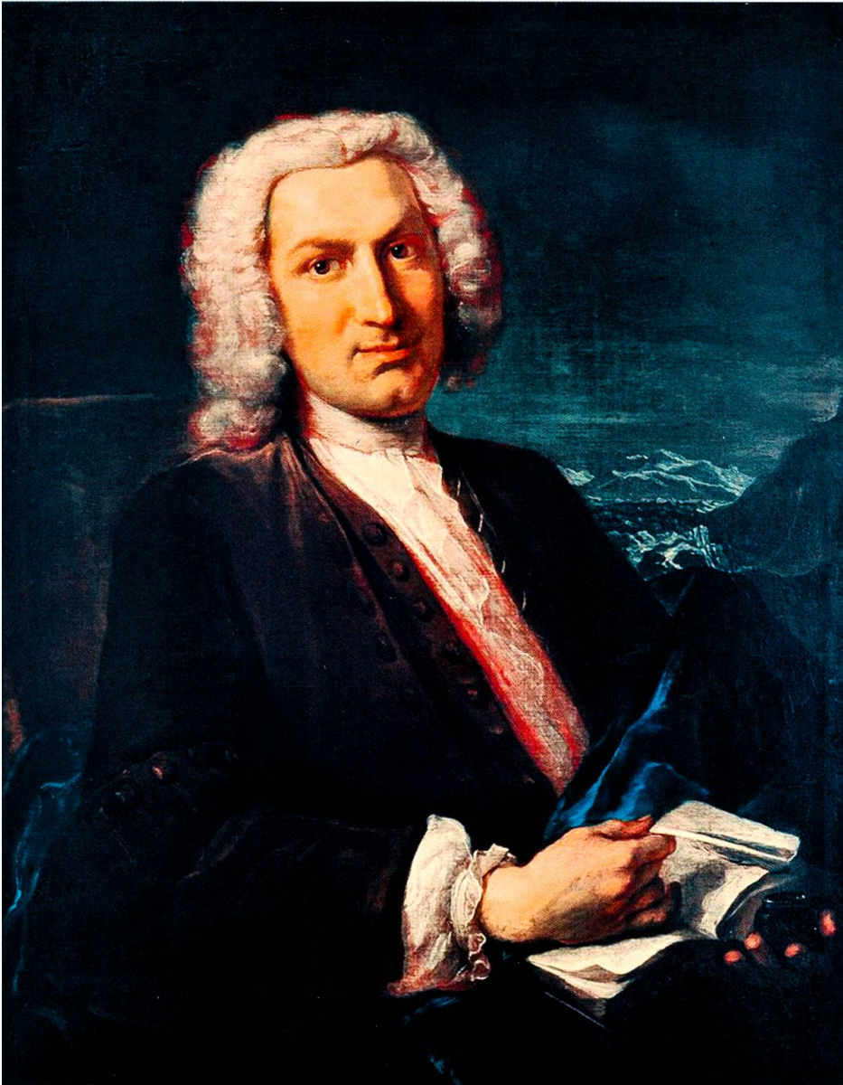
Bildnis Albrecht von Hallers (1708–1777) von Johann Rudolf Huber, 1736. Im Hintergrund ist das Gebirge zu erkennen, dem der Berner sein berühmtes Gedicht gewidmet hat. (Burgerbibliothek Bern)

von Reinheit und Schwere eine moralische Wertung der konkreten Akteure der Handlung (Bergleute versus Vögte) vorgenommen. Somit erhielt die bereits bei Gessner fassbare wertende Unterscheidung der freien Berg- und schweren Stadtluft eine neue Prägung, die im 19. Jahrhundert trotz den politisch zunehmend dominierenden eidgenössischen Stadtorten auch für nationalpatriotische Bemühungen fruchtbar gemacht werden konnte. Der wirkungsmächtige wertende Antagonismus von trostloser Stadt oder tristem Flachland und wunderbarem Gebirge ist auch in vielen der im Folgenden zitierten Werke (etwa in Rousseaus «Julie», von Salis-Seewis' «Elegie» oder Spyris «Heidi») stets mitzudenken.