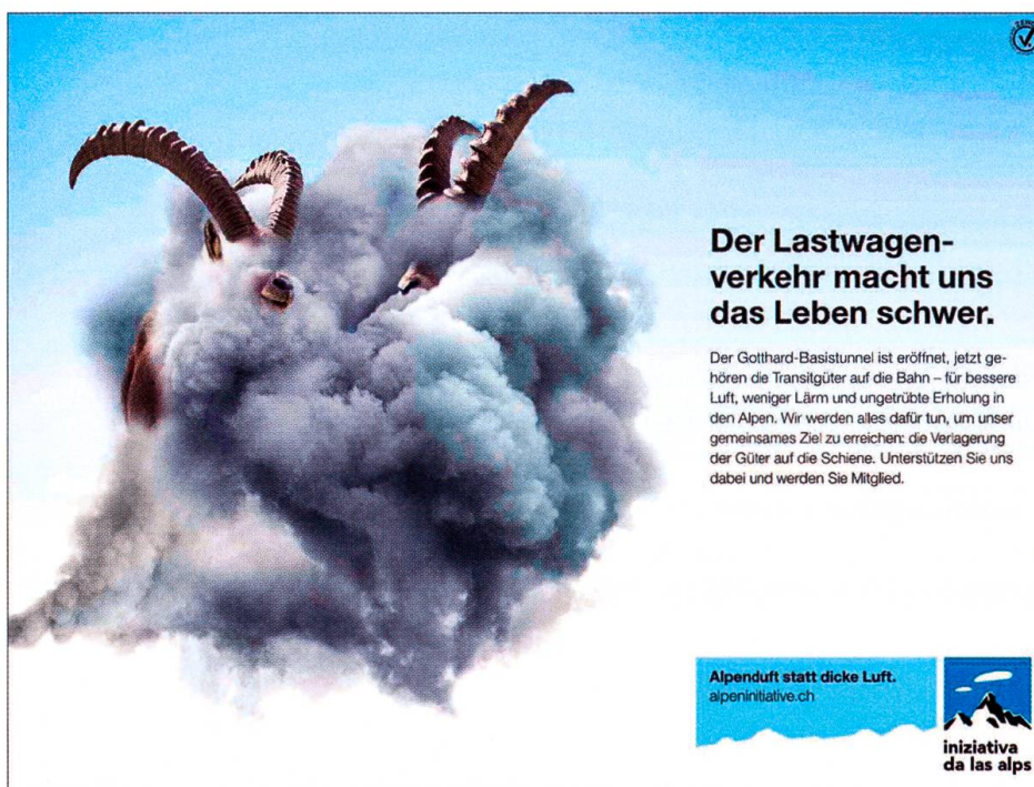
Alpenluft statt dicke Luft. Inserat der Alpeninitiative, 2017.

Der Topos der Alpenluft hält sich also hartnäckig im medizinischen und touristischen Alpendiskurs. Dies dürfte mit ein Grund sein, warum er auch im modernen ökologischen Alpenschutzdiskurs als gewichtiges Argument vorgebracht wird. So weist Aurel Schmidt 1990 in seinem Plädoyer für den Alpenschutz darauf hin, dass im von der Gotthardautobahn durchzogenen Urner Reusstal extreme Stickstoffoxidmengen die Luft belasten. 57 2019 feierte die Naturschutzorganisation Alpeninitiative, benannt nach der gleichnamigen Volksinitiative, ihr 25-Jahr-Jubiläum. 1994 hat das Schweizervolk die «Alpeninitiative» angenommen, die einen Schutz vor den Auswirkungen des Transitverkehrs und dessen Verlagerung auf die Schiene verlangte. Der Verein «Alpeninitiative» überwacht seither die (bislang harzige) Umsetzung dieser Initiative. 58 Dabei verwendet sie den ökologisch aufgeladenen Alpenluft-Topos als Werbemotiv. «Alpenluft statt dicke Luft» lautet der Slogan eines kürzlich erschienenen Inserats, das ein an