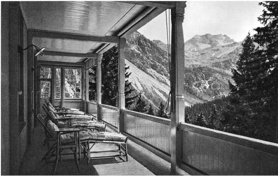
Liegebalkon im Parksanatorium Arosa um 1910 mit majestätische Alpenpanorama. Die hochalpine Luft sollte zur Genesung verhelfen.

sondern aus Hamburg: Stadt, Meer, Flachland. So leer ihm nämlich die Luft der Alpen erscheint, so voll nimmt er die des Flachlandes wahr: «Es wehte eine köstliche, feuchte, vom Atem der Bäume balsamierte Luft. [...] Wie schön! O Heimatodem, Duft und Fülle des Tieflandes, lang entbehrt. Die Luft war voller Vogellaut [...]. Hans Castorp lächelte, dankbar atmend.» 53 Es findet bei Mann also eine regelrechte Umkehrung des Alpenluft-Topos statt: Die Alpenluft ist leer und nichtig, die Luft des «Tieflandes» dagegen köstlich und voller Düfte und Klänge. Hieran zeigt sich, dass die Charakterisierung der Luft durchaus vom Standpunkt des oder der Schreibenden, beziehungsweise der literarischen Figur, abhängig ist. Dabei spielt die Frage eine Schlüsselrolle, welche Landschaft als Heimat aufgefasst und idealisiert werden soll.