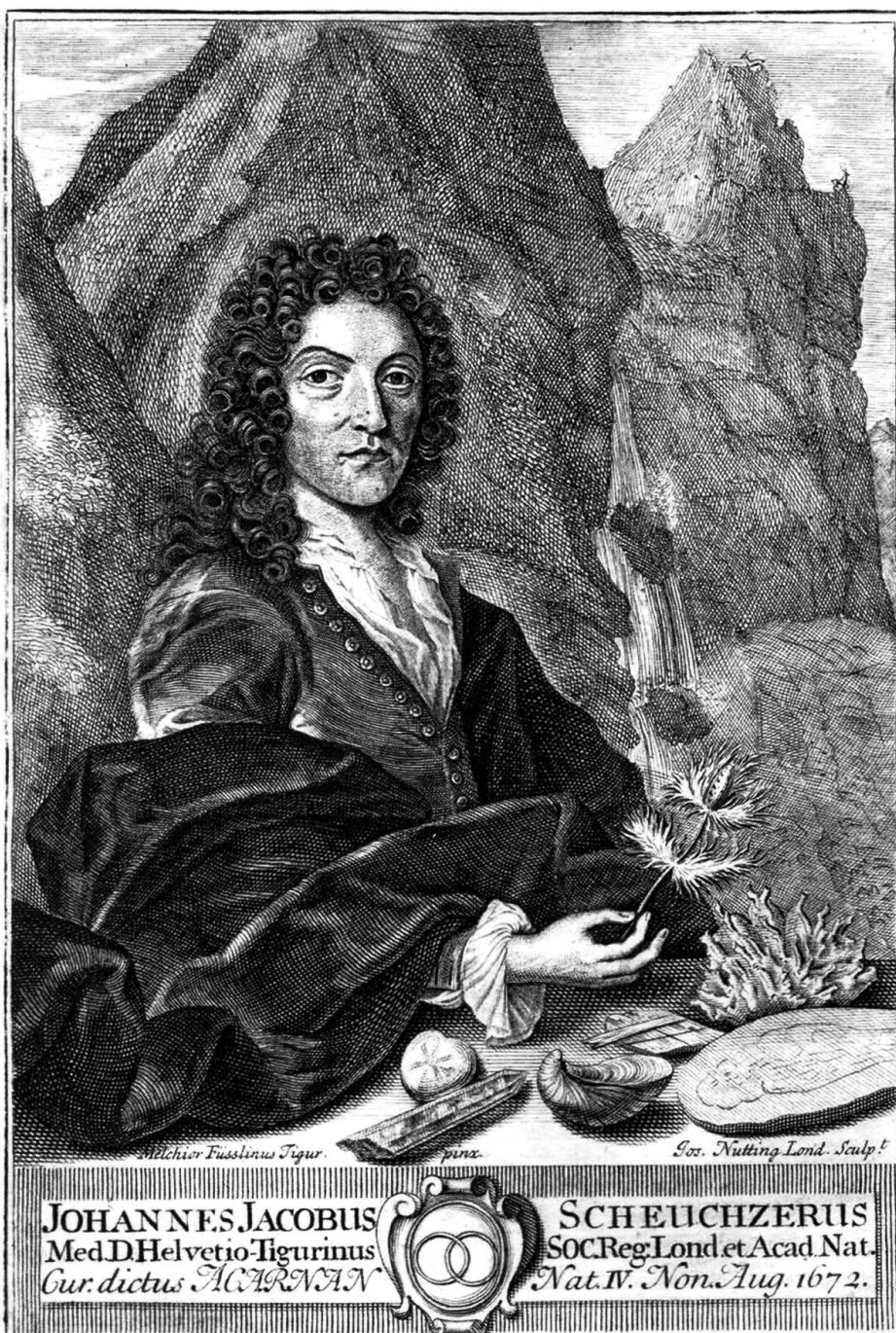
Bildnis Johann Jakob Scheuchzers (1672–1733) aus dem Jahr 1708. Die Druckgrafik zeigt den Zürcher im Gebirge mit vermeintlichen Relikten der Sintflut. (Aus: Johann Jakob Scheuchzer: Helveticus sive Itinera alpina tria , London, 1708)

Dass der Luft der Berge eine spezifische Qualität zukomme, war Gegenstand aufklärerischer Naturphilosophie. Bereits für den Zürcher Arzt und Alpenforscher Johann Jakob Scheuchzer (1672–1733) spielte die Luft eine Rolle: In einem an Alpenbewohner gerichteten Fragebogen wollte er 1699 unter anderem wissen, «wie der Luft beschaffen in verschiedenen Orten des Schweizerlands / in unterschiedlichen Abtheilungen / oder Höhenen der Alpen / und anderer hohen Bergen / sonderlich in Ansehung der