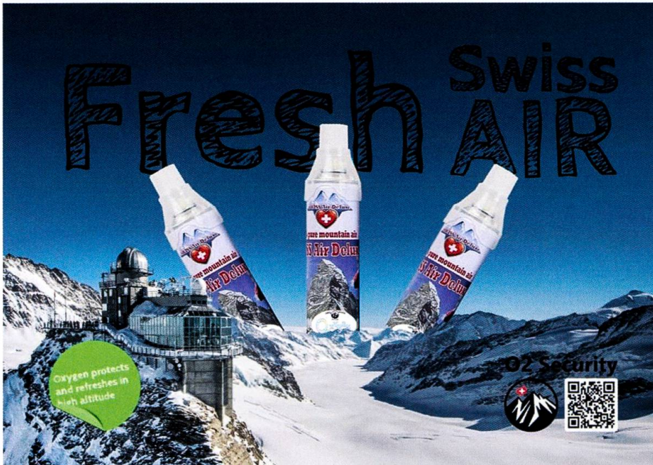
FrISChe Luft, «geerntet» in den Schweizer Alpen. Inserat für Swiss Air Deluxe, 2019.

Heidi gemahnendes Hirtenmädchen eingehüllt von Abgaswolken zeigt. 59 In einer anderen Version sind zwei Steinböcke in der Abgaswolke zu sehen, die an die Bündner Tourismus-Maskottchen Gian und Giachen erinnern. 60 Trotz ihrer Affinität zur Bergluft hat die Alpeninitiative ebenfalls 2019 ihren berüchtigten Schmähprijs «Teufelsstein» an ein Unternehmen vergeben, dessen Handelsgut ebendiese Alpenluft ist. Die Firma «Swiss Air Deluxe» exportiert kurioserweise konzentrierte Schweizer Bergluft in Dosen nach Asien. 61 Bei aller Liebe zur Alpenluft scheinen die Mitglieder der «Alpeninitiative» für deren ökologisch fragwürdigen Export doch kein Verständnis zu haben. Diese Anekdote, so skurril sie klingt, macht deutlich, dass die von Konrad Gessner gerühmte Alpenluft auch heute noch hoch im Kurs steht und ein Politikum darstellt.