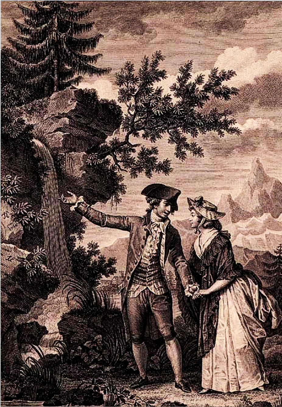
Saint-Preux und Madame de Wolmar beim Wasserfall von Meillerie. Illustration um 1780 zum Roman «Julie ou la Nouvelle Héloïse» des Genfers Jean-Jacques Rousseau (1712–1778).

Auch die Lyrik der Zeit griff das Thema auf: Johann Gaudenz von Salis-Seewis, der wohl berühmteste Dichter Graubündens, trat in seiner 1785 in der fernen Grossstadt Paris 18 verfassten «Elegie an mein Vaterland» 1785 eine Art Flugreise in seine Heimat an: