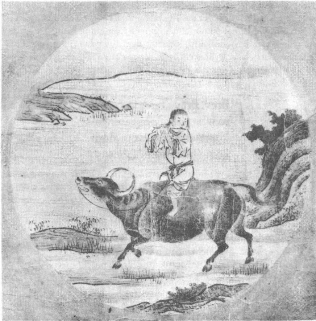
Han rir hjem på oxen