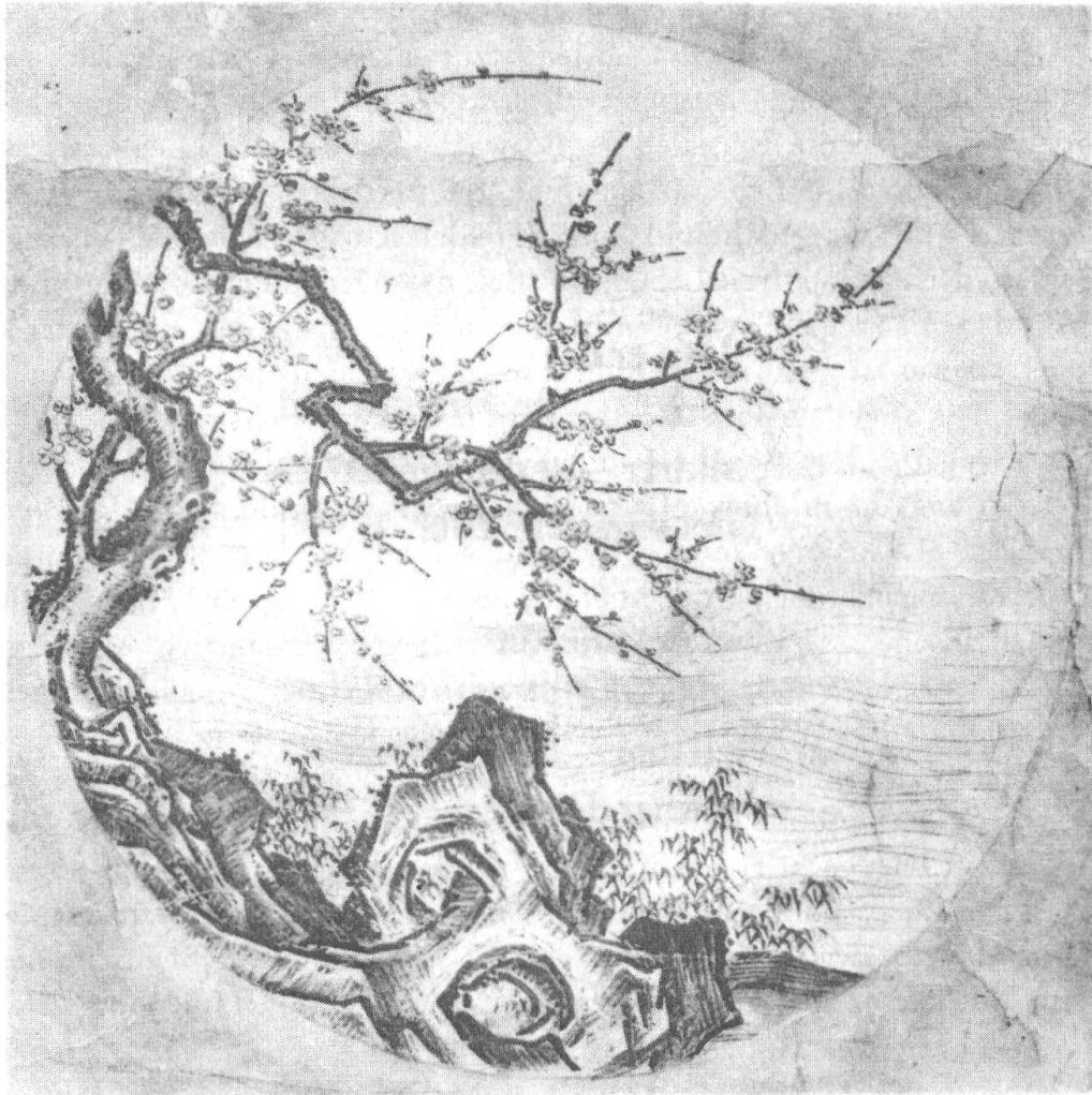
Tilbake til kildene