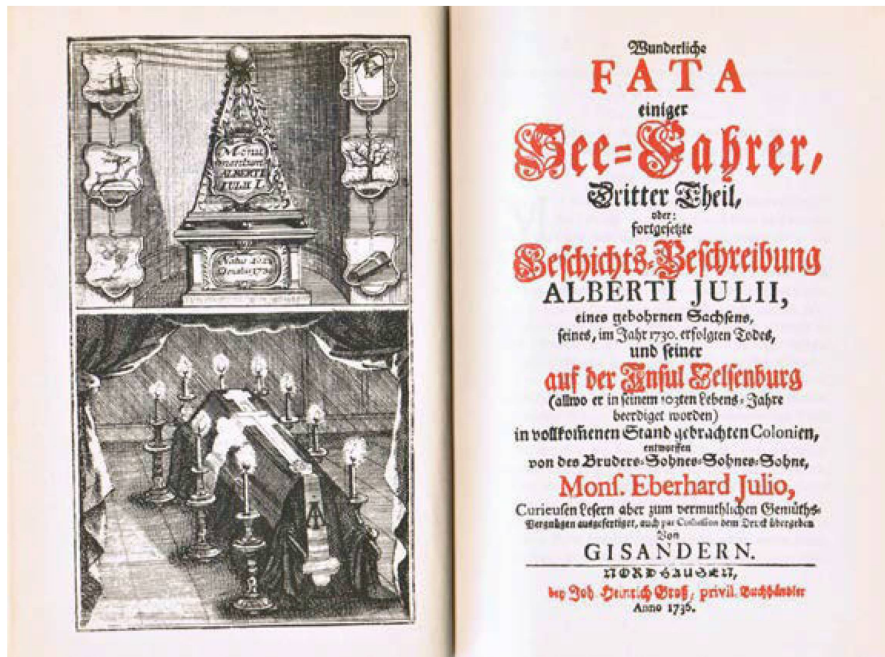
Abb. 8: Titelblatt und Frontispiz der Erstausgabe des 3. Teils der Wunderlichen Fata . Herzog August Bibliothek Wolfenbüttel Lo 6958.