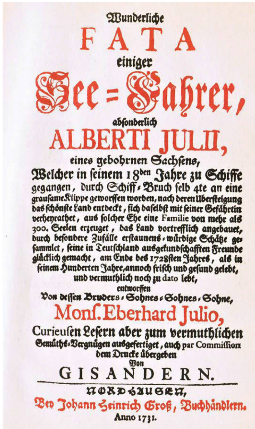
Abb. 6: Titelblatt der Erstausgabe des 1. Teils der Wunderlichen Fata .

Herzog August Bibliothek Wolfenbüttel Lm1059. © Verlag Zweitausendeins