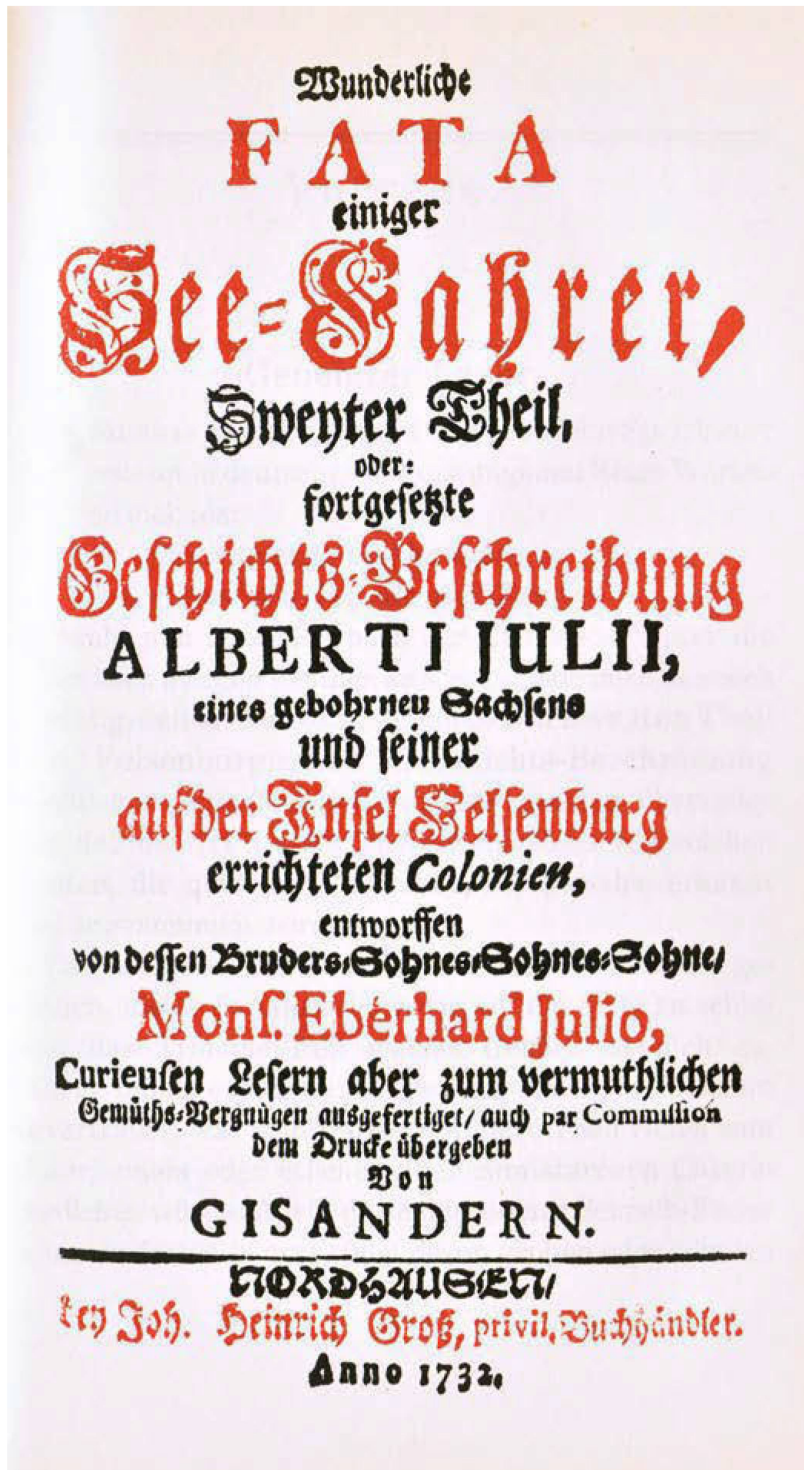
Abb. 7: Titelblatt der Erstausgabe von Teil 2 der Wunderlichen Fata. Herzogin Anna Amalia Bibliothek Weimar 32,3: 59 o.

Der zweite Teil der WF präsentiert sich schon im Titelblatt als Fortsetzung und erwähnt nun auch den Namen „Insel Felsenburg“ – in roten gotischen Buchstaben, was die Hauptperson Albert Julius (in schwarzer Antiqua) optisch etwas zurückdrängt; sonst aber bringt das Titelblatt im Vergleich zu jenem des ersten Teils wesentlich weniger Informationen, wohl, weil der Leser ja schon weiss, worum es sich bei dem neuen Buch handelt, das 1732,