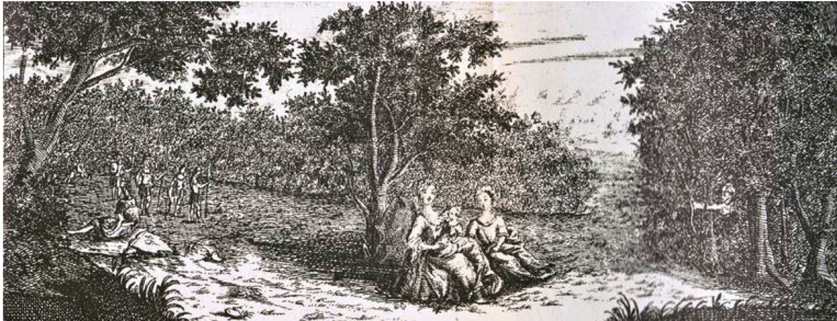
Abb. 10: Szene aus dem Frontispiz des 4. Teils der Wunderlichen Fata . Niedersächsische Staats- und Universitätsbibliothek Göttingen 8° Fab.Rom. VI, 2525 b .

Der vierte Teil der WF , der im Gegensatz zu den Teilen 2 und 3 von Schnabel nicht angekündigt wurde, bringt im Titelblatt, nach der bereits bekannten Fortsetzungsformel, in roten Antiqua-Grossbuchstaben den Namen der persisch-candaharischen Prinzessin Mirzamanda, deren Lebensgeschichte „fast ein Haupt-Stück der Felsenburgischen Geschichte“ ausmache. Dies unterstreicht das dreigeteilte Frontispiz, dessen grösstes und detailreichstes Bild ein schreckliches Ereignis im Leben der Mirzamanda darstellt, nämlich die Ermordung ihrer Mutter, die sie als ganz kleines Kind miterlebte.