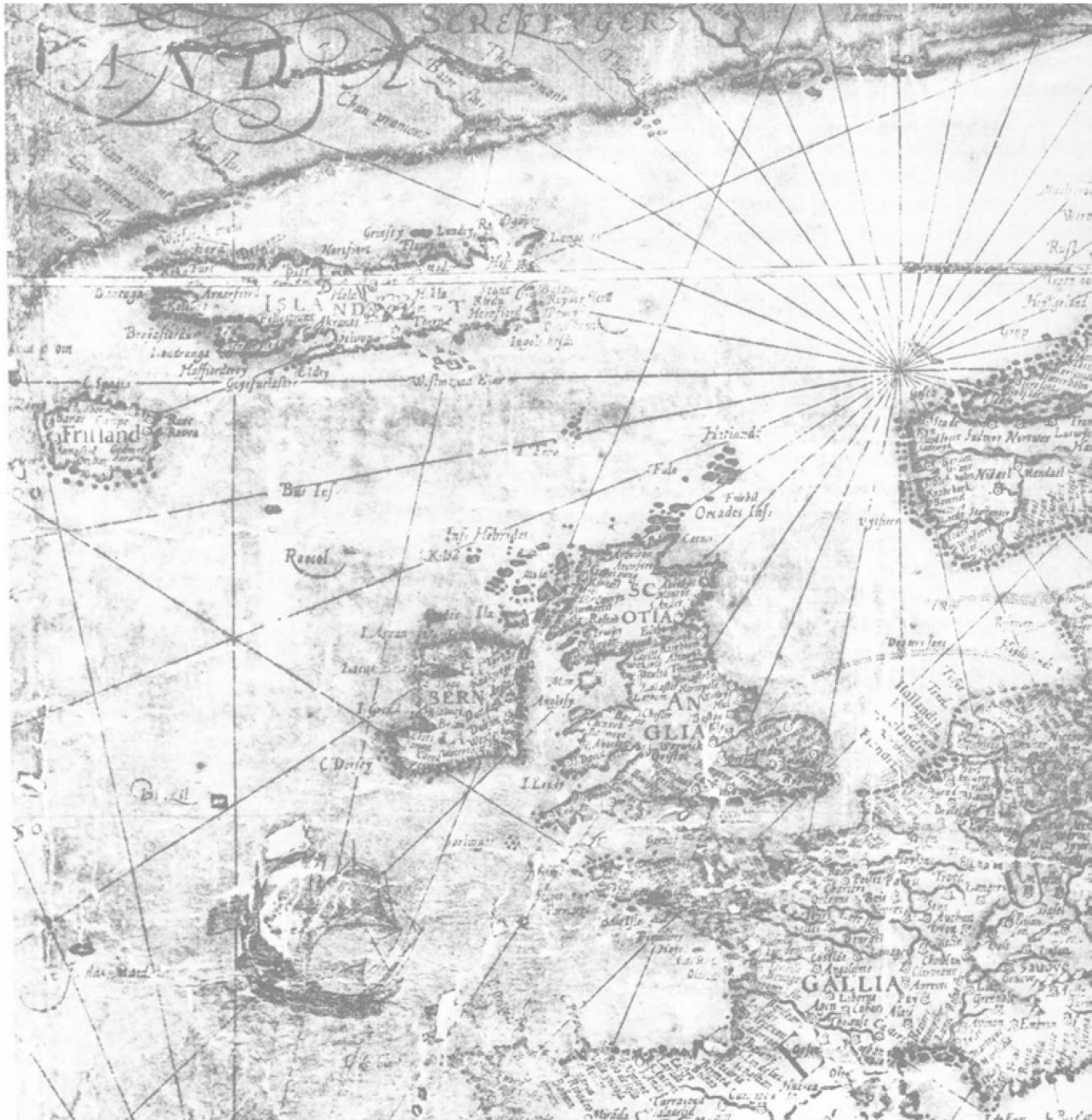
Abb. 8: Henricus Florentius van Langren, „Nova et accurata totius orbis terrarum geographica et hydrographica tabula“, ca. 1599, Ausschnitt des nördlichen Atlantiks, u. a. mit von Norden nach Süden Island, Frisland, Buss, Ibernia, Brazil (nach Haraldur Sigurðsson 1978: 24)