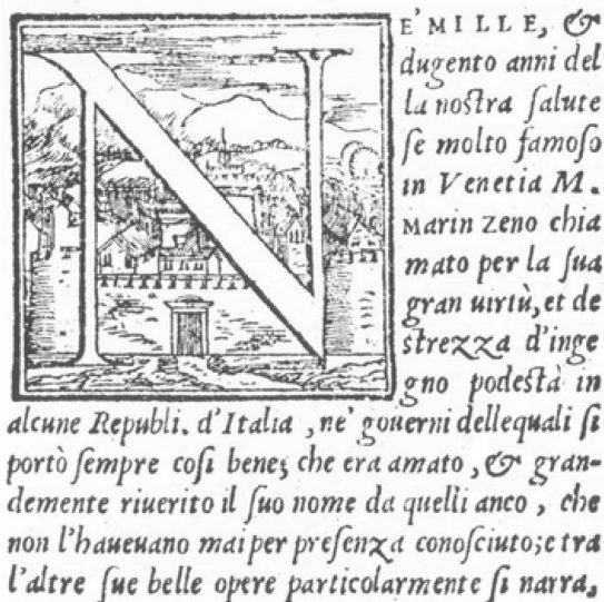
Abb. 4: Nicolò Zeno d. J., De i commentarii , Venedig: Francesco Marcolini, 1558, Titel und Beginn von Dello scoprimento dell'isole Frislanda (privates Exemplar)