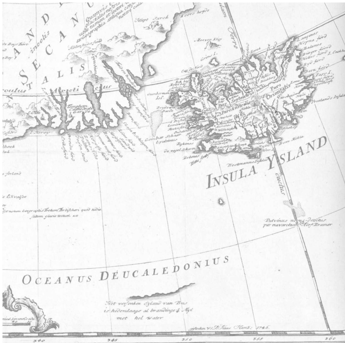
Abb. 7: Johann Anderson, „Nova Gronlandiae Islandiae et Freti Davis tabula“, Hamburg 1746, Legende zu der verschwundenen Insel von Buss (nach Haraldur Sigurðsson 1978: 64)

als ‚Versunkenes Eyland‘ dargestellt. Die letzte kartographische Darstellung von Buss stammt von 1856. Die Suche nach ihr, unter anderem mit Echolot, wurde jedoch erst zu Beginn des 20. Jahrhunderts definitiv eingestellt, ehe es 1934 schließlich zur offiziellen Aberkennung ihrer Existenz kam: „After more than three centuries of fruitless efforts to validate its existence, Buss Island had, finally and officially, become a phantom“ (siehe Johnson 1994: 107–130, hier S. 130).