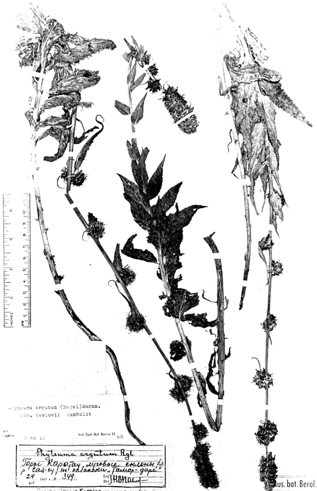
Tafel B. — Asyneuma argutum subsp. pavlovii (Paratypus, B).