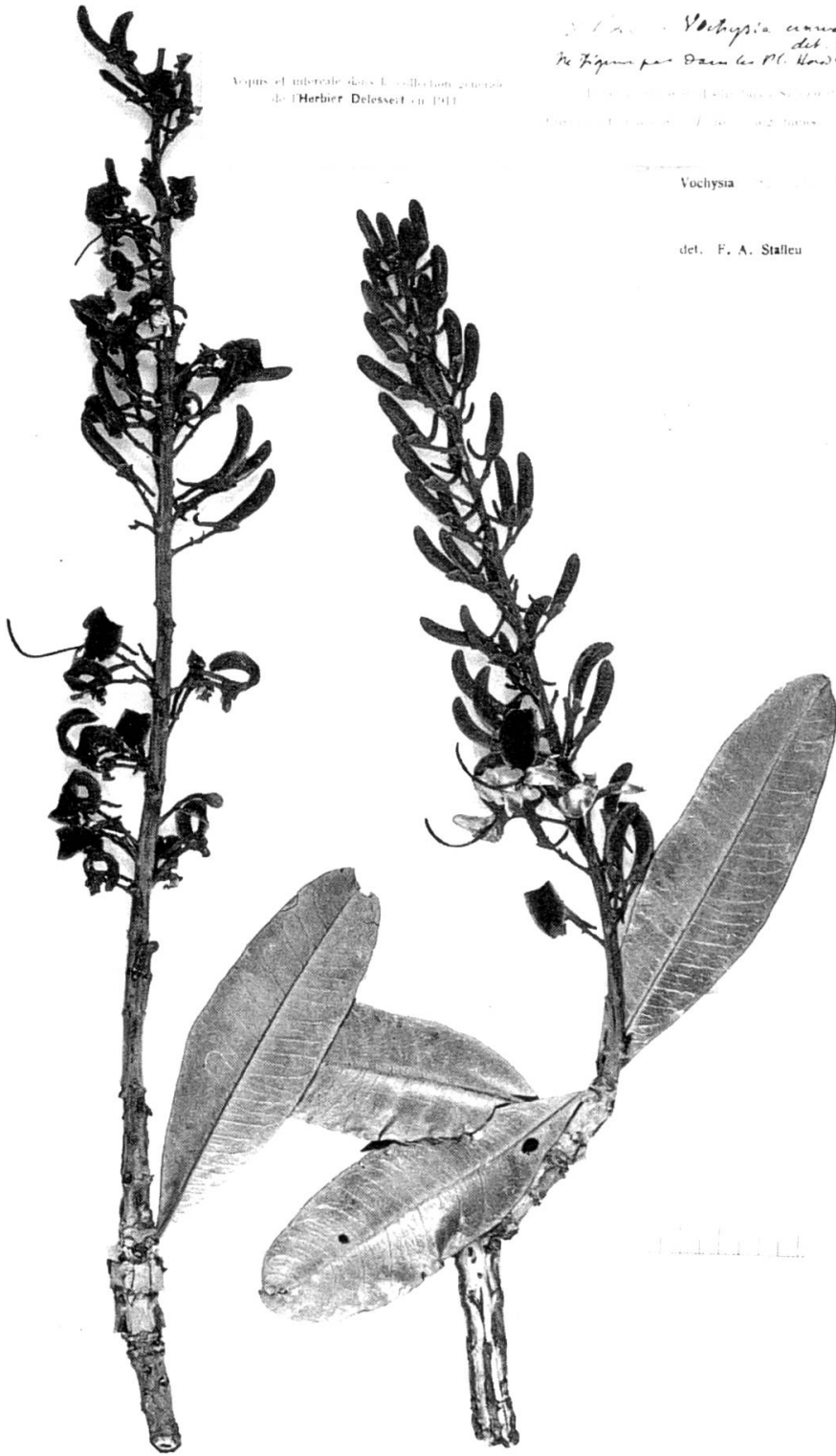
Fig. 66. — Vochysia cinnamomea Pohl.