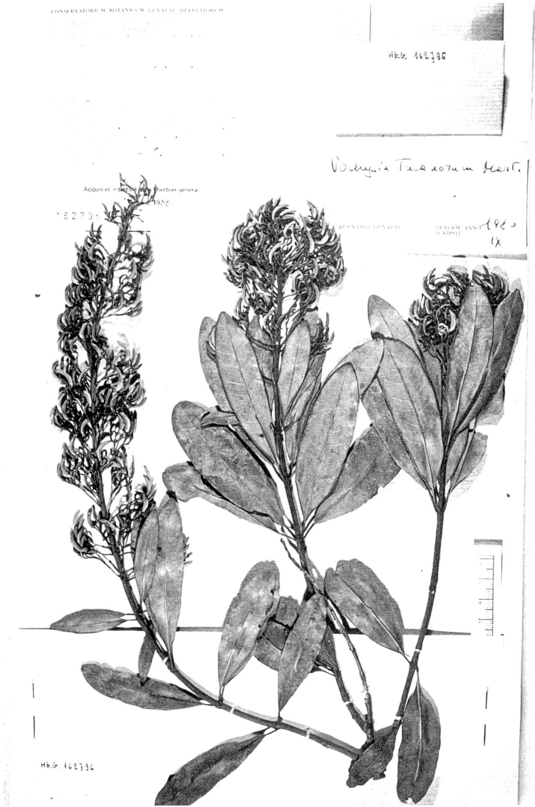
Fig. 67. — Vochysia tucanorum Mart.