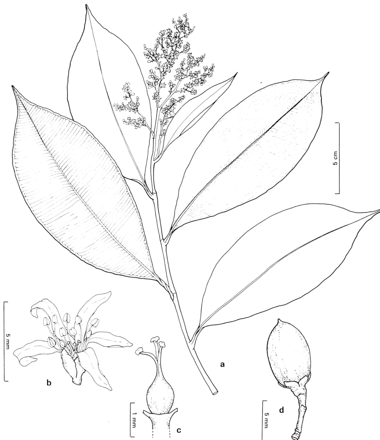
Fig. 2. — Roucheria punctata (Ducke) Ducke (Árbol 1/134): a) ramita florífera; b) flor; c) gineceo; d) fruto.