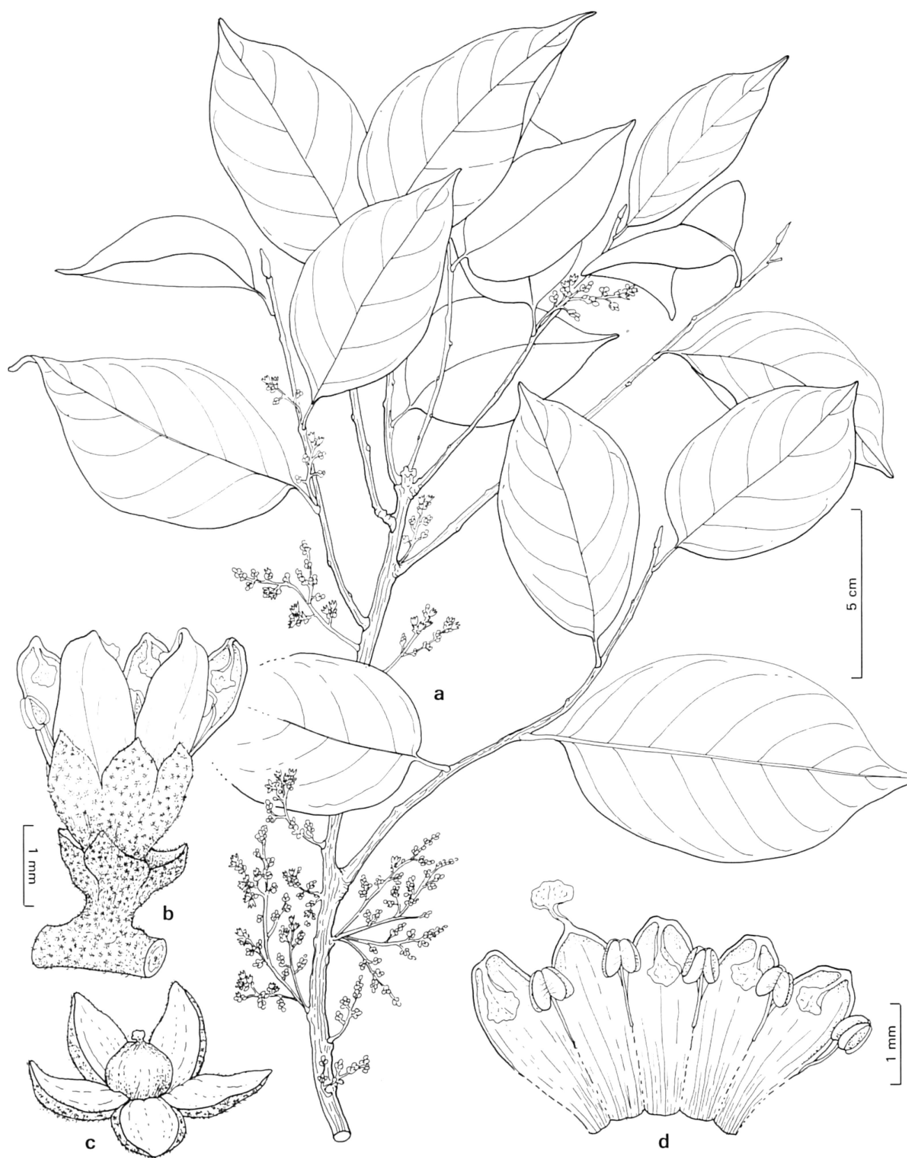
Fig. 80. — Dendrobangia boliviana Rusby (Árbol 8/175): a) ramita e inflorescencias; b) flor; c) pistilo con los sépalos; d) pétalos apendiculados y estambres soldados a la corola por la base de los filamentos.