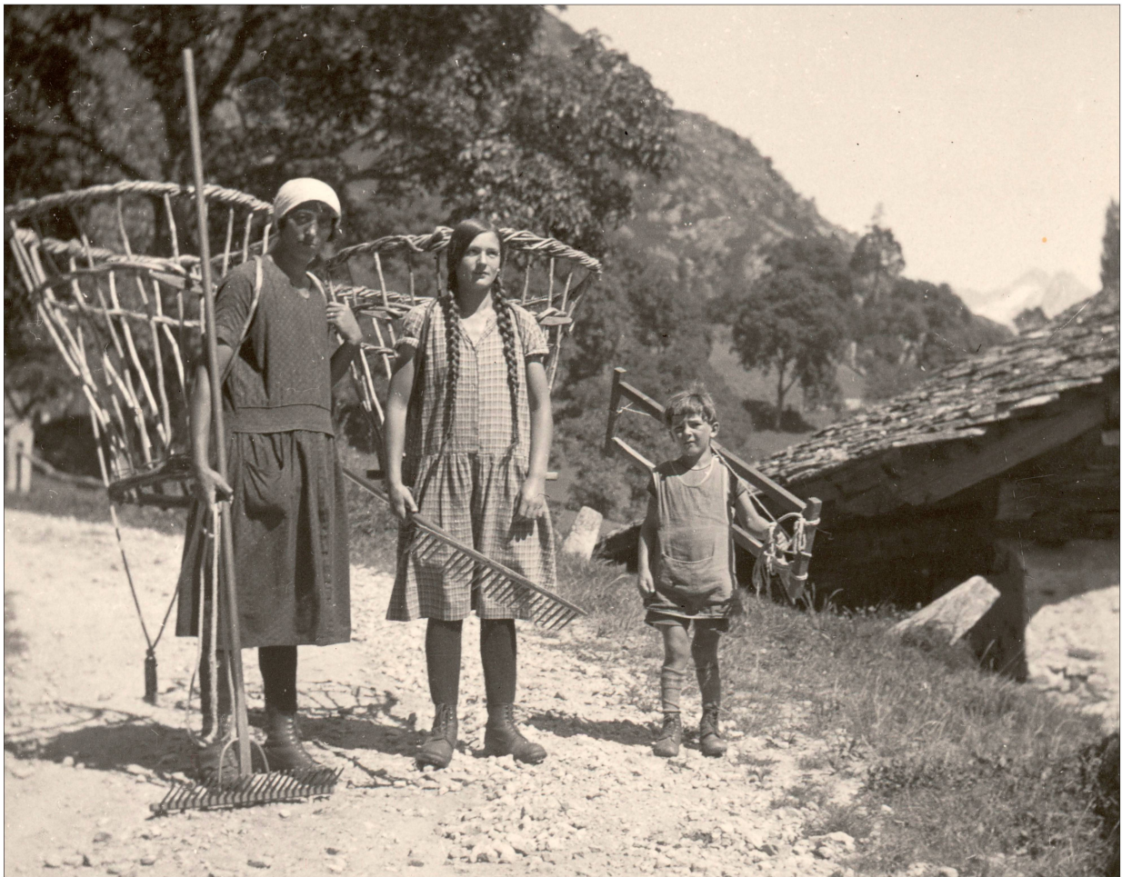
Foto 25: Mit „campac“ (Tragkorb) und „frascera“ (Holzrahmen mit Schnur) wurde früher das Heu von den abgelegenen Magerwiesen in den Heustall getragen. Bei Soglio, um 1930.

Die gemähten Wiesenflächen waren viel umfangreicher als heute. Gemäht wurden alle offenen Flächen auf dem Talgrund, die unzähligen Matten auf dem rechten, südexponierten Talhang, etliche Waldlichtungen auf dem linken Talhang, sowie die steilen Wildheuflächen in der subalpinen und sogar in der alpinen Sufo (Mähder). Die genannten Flächen sind heute zum grössten