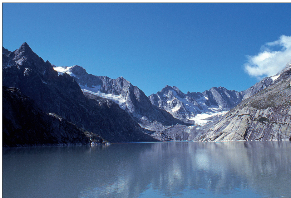
Foto 23b: Die gleiche Stelle mit dem Stausee nach dem Bau des Staudammes. 2003.