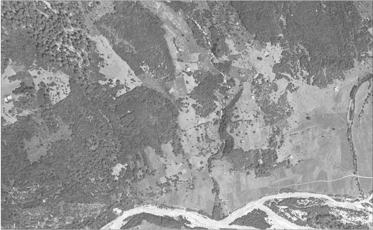
Foto 24a: Südexp. Hang nordwestl. Vicosoprano. Ca. 1920-1930.