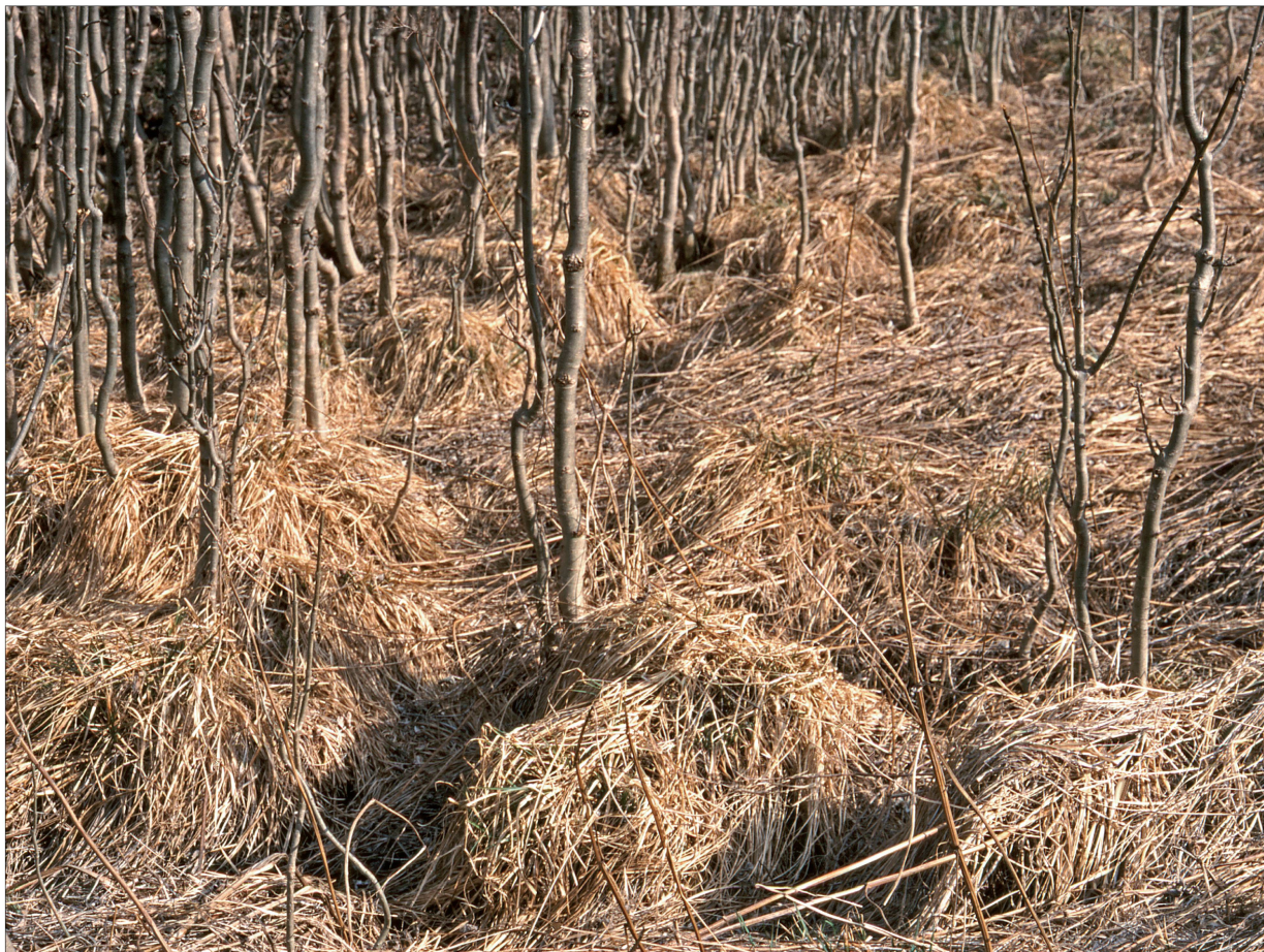
Foto 26: Verlassene ehemalige feuchte Mähwiese westl. Vicosoprano. April 2003.

Nach dem zweiten Weltkrieg wurden im Talboden eine ganze Reihe von sumpfigen Flächen mit kleinen Teichen mittels Kanalisationsystemen trocken gelegt. Die bereits spärlich vorhandenen Feuchtgebiete im Tal wurden dadurch noch stärker reduziert. Die wasser- und feuchtigkeitsliebenden Pflanzengesellschaften haben als Folge stark darunter gelitten.