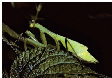
Mantidae Cardioptera sp. 1