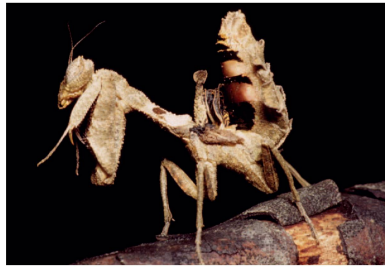
Acanthopidae Decimiana sp. 1 (fêmea)