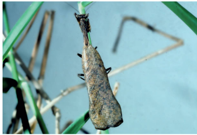
Acanthopidae Decimiana sp. 1 (macho)