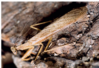
Thespidae Thespidae sp. 1