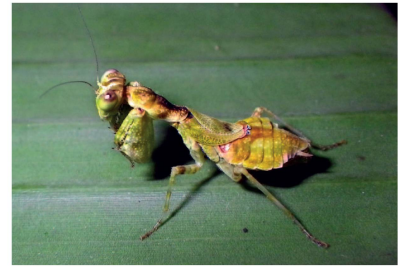
Acanthopidae Acontista sp. 1