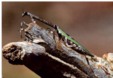
Mantidae Phyllovates sp. 1