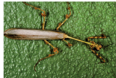
Mantidae Zoolea sp. 1