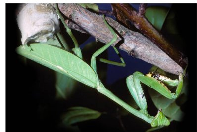
Mantidae Stagmatoptera aff. femoralis