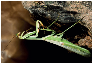
Mantidae Stagmatoptera sp. ( S. femoralis ou S. precaria )