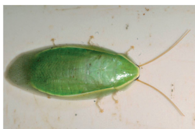
Blaberidae Panchlora prasina