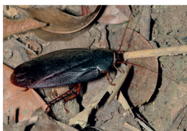
Ectobiidae Nyctibora sp. 1