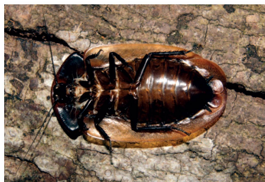
Blaberidae Petasodes dominicana (adulto)