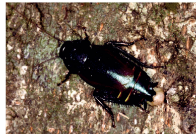
Blaberidae Pelmatosilpha sp. 1