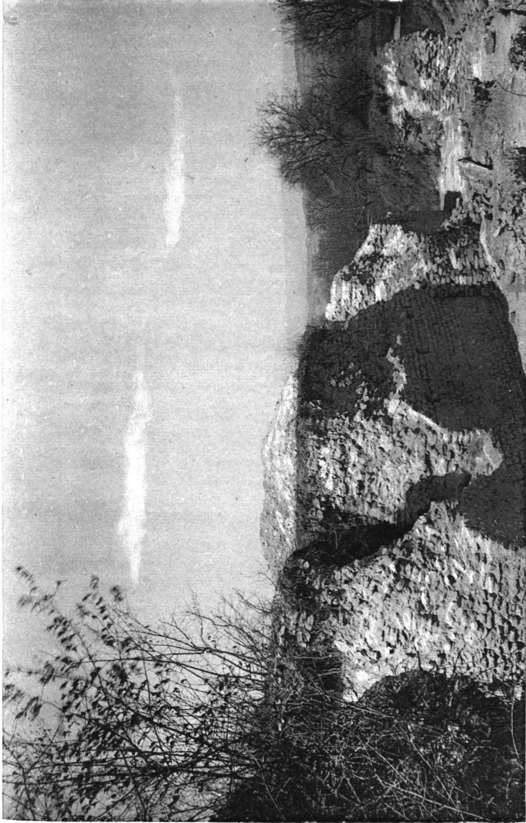
LES FOUILLES AU THÉÂTRE — SECTION DU COULOIR CIRCULAIRE B