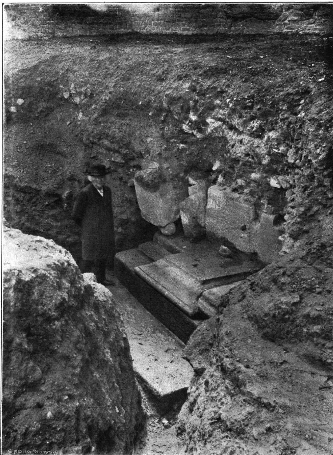
Au Rafour, avril 1907.