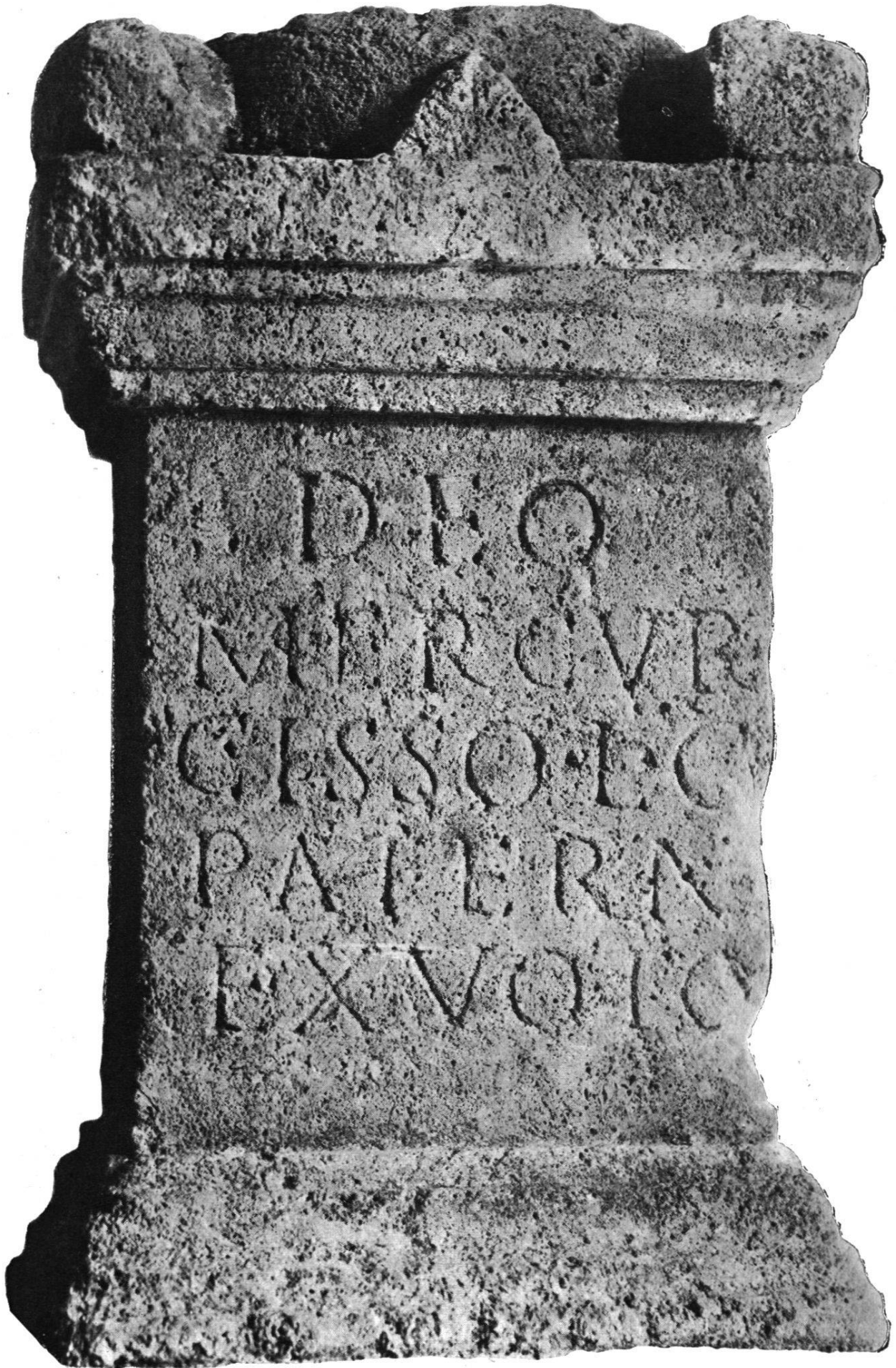
Autel votif de Mercure Cissonius.