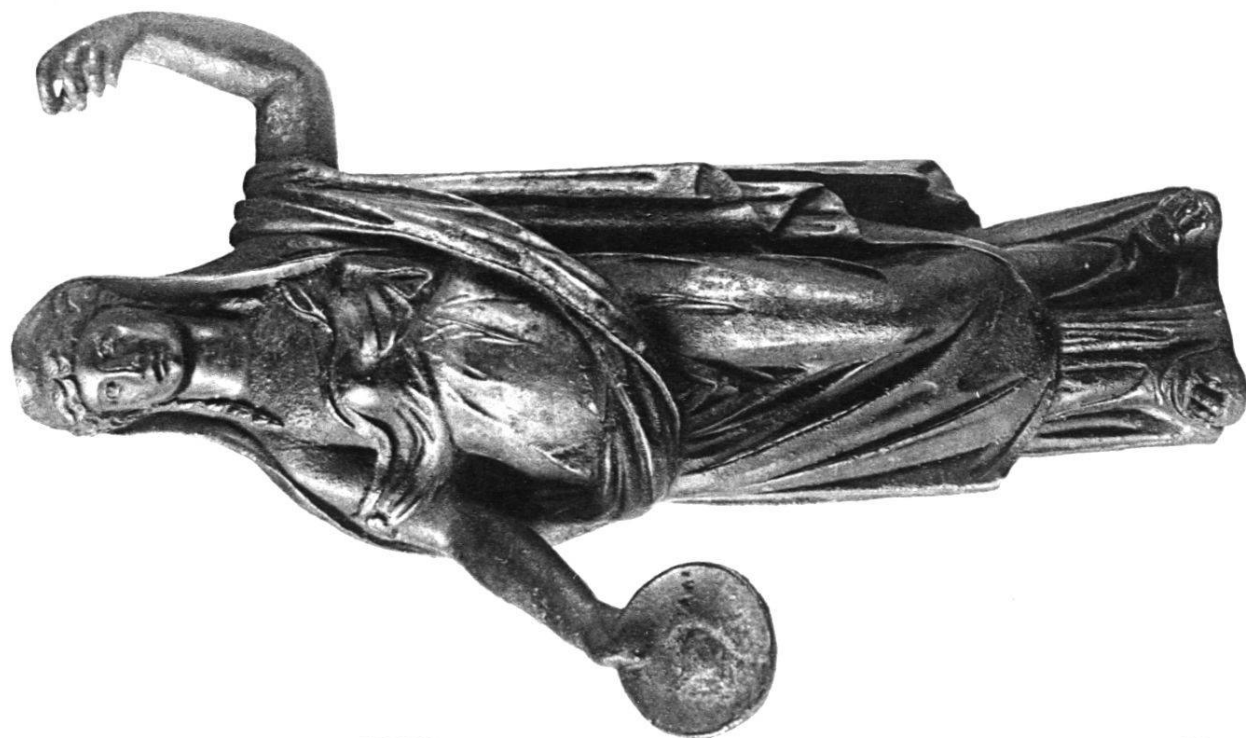
1. Junon (Avenches)