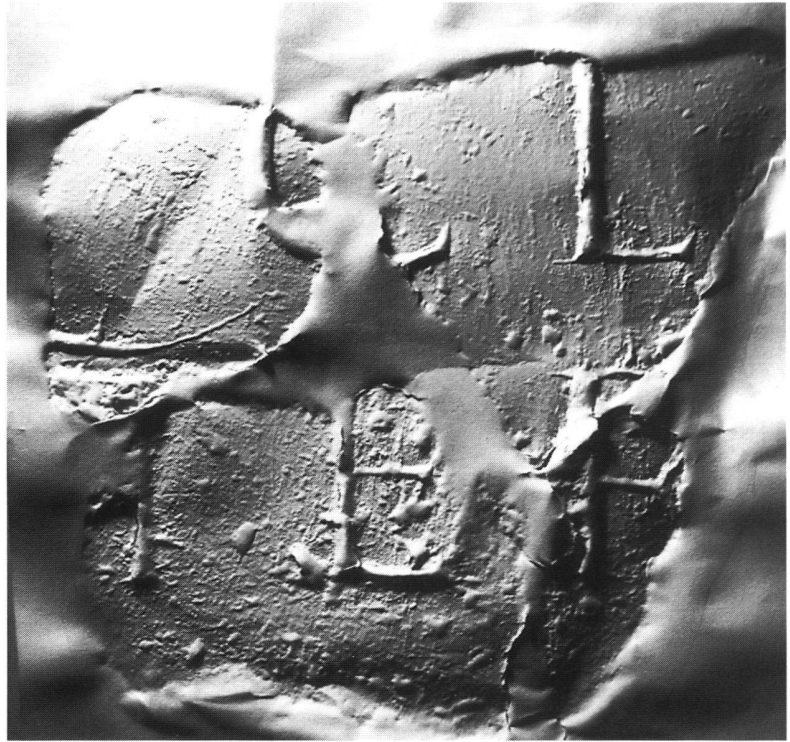
Fig. 1. Bloc A