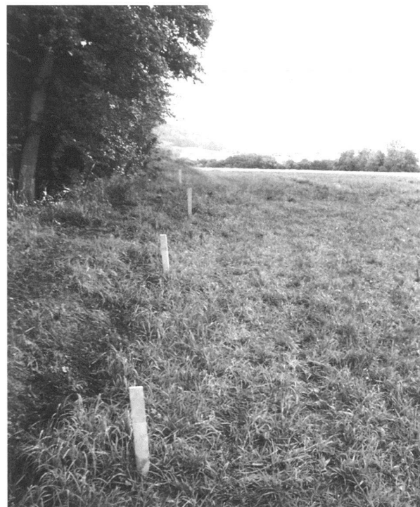
Fig. 2. Piquetage du tracé de l'aqueduc de Bonne Fontaine à proximité du Creux de la Chetta.

Ce n'est qu'avec la recherche du second aqueduc, celui de Coppet, que la conduite a été suivie du départ à la fin sans interruption, si ce n'est dans les champs cultivés. Ceux-ci sont très nombreux dans la Broye et constituent un inconvenient de taille. Heureusement, la variété des cultures permet malgré tout l'accès, selon les saisons. C'est également au cours de la reconnaissance de cet aqueduc que la procédure a été définitivement arrêtée. Nous avons planté des piquets sur le tracé présumé, ce qui nous a per-