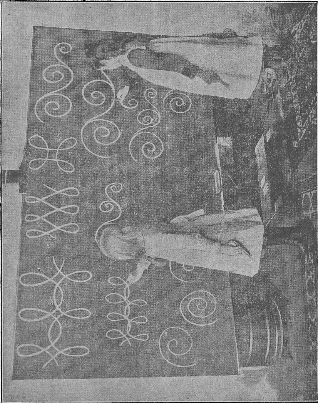
Pl. 1. — Dessin à la craie dans le degré le plus élémentaire, syst. Liberty Tadd

Prang exposait huit grandes planches renfermant tous les travaux du système : A, en construction, dessin et figures géométriques ; B, représentation (dessin d'après nature) ; C, décoration et harmonie des couleurs. La confection d'objets de formes géométriques, de cubes, de travaux de céramique, complète la méthode.