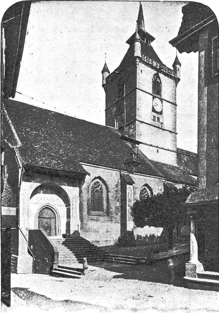
ESTAVAYER. Eglise de Saint-Laurent.

Mais la fourmi de Léon Duc n'est pas plus prêteuse que celle de La Fontaine. Le bon chocolat qui fume sur sa table n'est point pour sa voisine la cigale. Celle-ci, excellente musicienne et