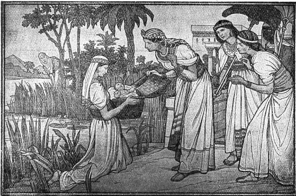
Schumacher : Moïse sauvé des eaux.

L'histoire biblique a obtenu des éditeurs une sollicitude qui n'a pas été prodiguée aux images pour l'enseignement dogmatique. Les instituteurs, pourvus d'excellent matériel