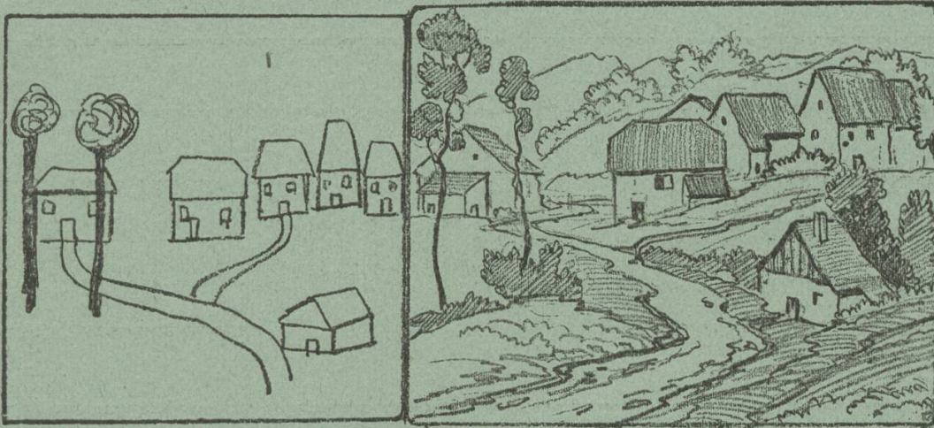
Fig. 267. — Dessin d'élève.