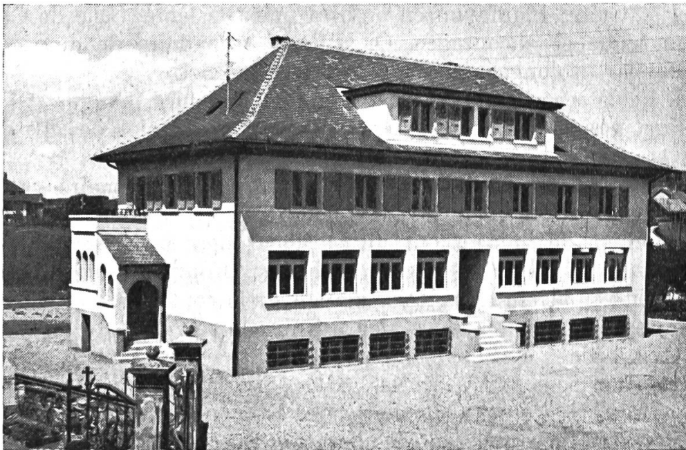
UNE ÉCOLE DE CAMPAGNE CONSTRUITE PENDANT LA GUERRE (SALES, GRUYÈRE)