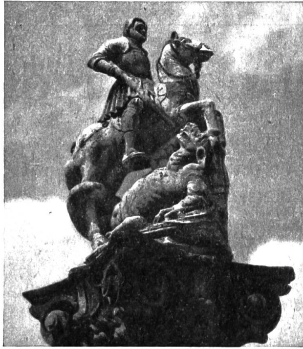
FONTAINE SAINT-GEORGES, A FRIBOURG