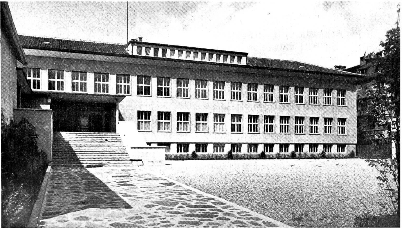
ÉCOLE SECONDAIRE PROFESSIONNELLE DES GARÇONS

qui vivait péniblement ; en voici deux dans un magnifique essor : Tavel et Guin ; Planfayon en ouvrira une troisième. Celle de Châtel fut soutenue et encouragée. Or, l'Ecole secondaire de district est un premier prolongement de l'Ecole primaire.