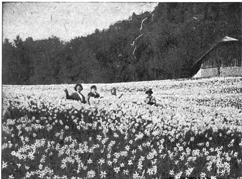
Champ de narcisses, sur Châtel-Saint-Denis