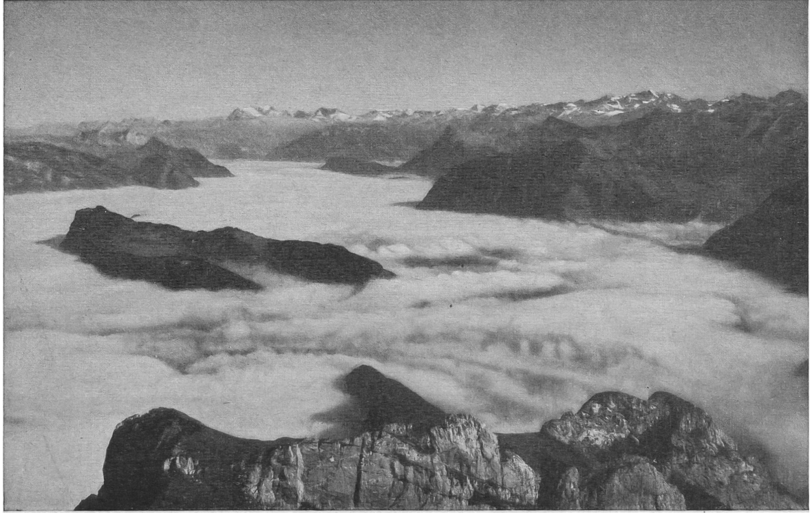
Nuages sur le lac des Quatre Cantons ; au centre le Bürgenstock.