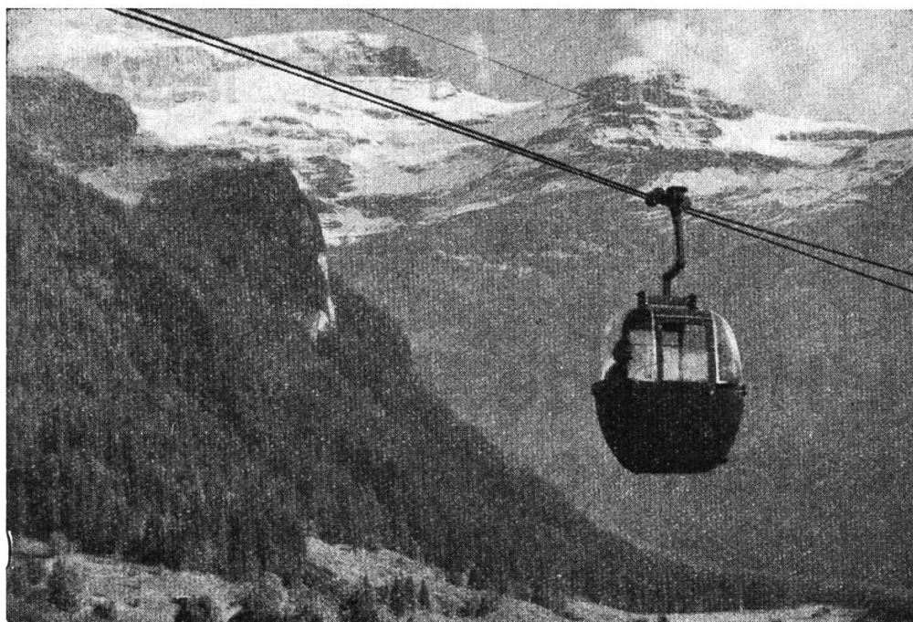
Le télécabine Diablerets-Isenau (durée du parcours 15 minutes)