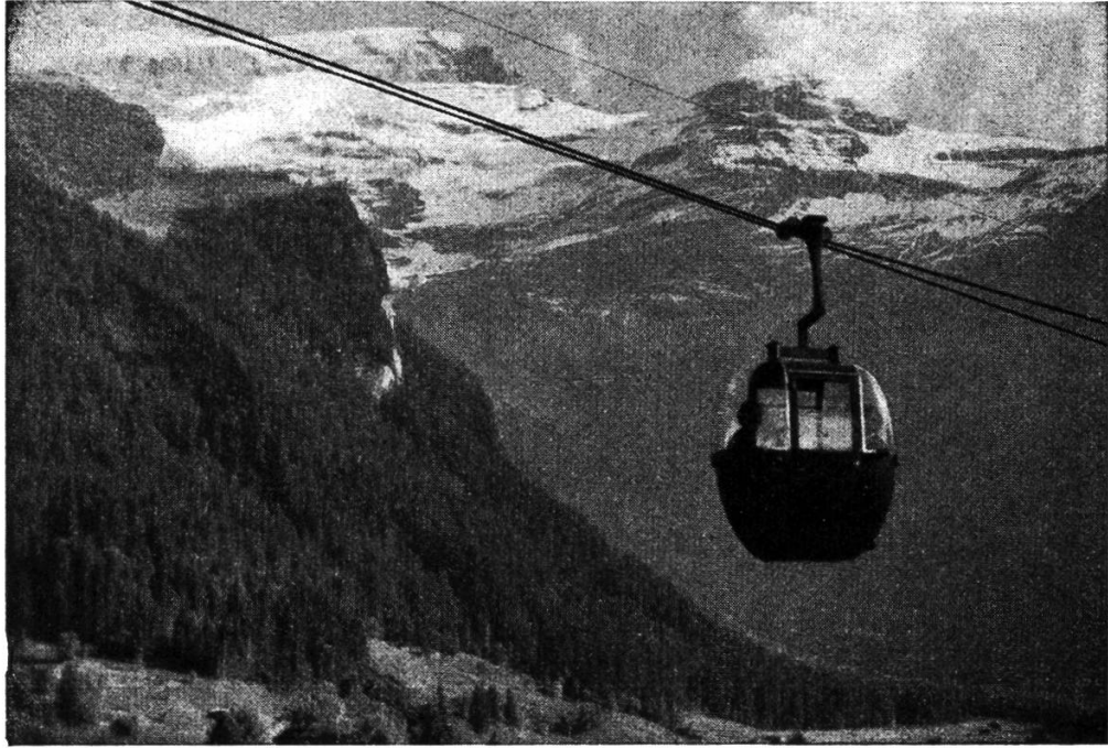
Le télécabine Diablerets-Isenau (durée du parcours 15 minutes)