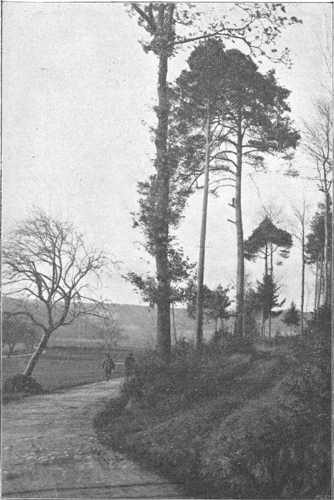
Ausgang aus den Brugger Waldungen nach Riniken.