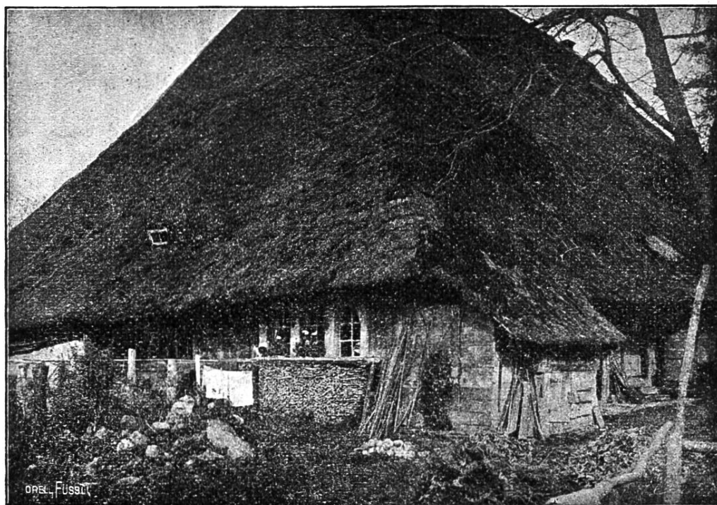
Erstes Schulhaus in Habsburg.

es ihm oft, eine trockene und aus den Geleisen gekommene Verhandlung zur Freude seiner Kollegen zum richtigen Abschluß zu bringen. In den Kommissionen, denen er angehörte, wurde seine Arbeitskraft hoch geschätzt, umso mehr als er nicht nur darauf ausging, neue Gesichtspunkte und Zielpunkte zu eröffnen, sondern auch mit aller Energie deren Verwirklichung förderte. Und darin liegt ein Hauptverdienst der Tätigkeit Werders: er schenkte