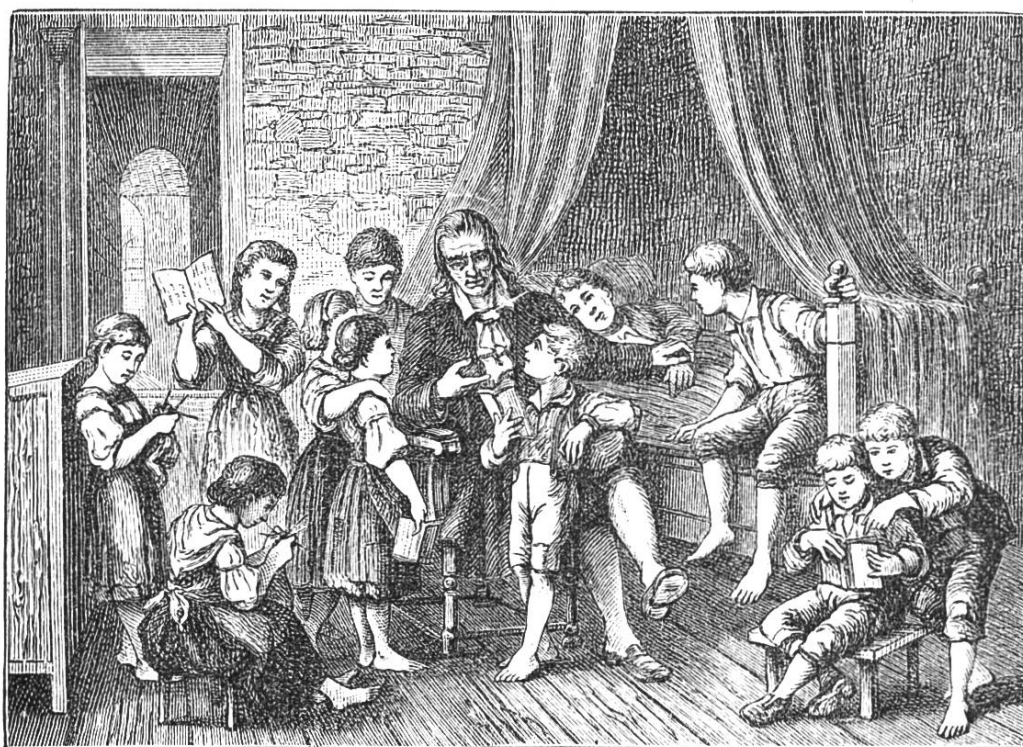
H. Pestalozzi, Vater der Waisen in Stans 1799.

neuerung der Lehrmethode zu wirken, indem er ihn veranlaßte, ein Volksblatt herauszugeben. Auch war Stapfer bemüht, die durch den Krieg geschlagenen Wunden zu heilen und übertrug zu diesem Zwecke ein in Stans für arme, verwaiste Kinder errichtetes Erziehungshaus der Leitung Pestalozzis, der hier Tag und Nacht voll Liebe und Hingebung zur Jugend arbeitete, trotzdem er wegen mannigfacher Anfechtungen und Hemmnisse fast in Verzweiflung geriet. Auch das höhere Schulwesen wollte Stapfer