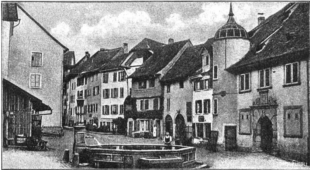
Hofstatt mit Zeughaus in Brugg.

welchen Sachen er heute nach Aarau abging.“ Am 25. Juni erhalten die Gemeinden Gottwil und Mandach einen strengen Mahnbrief von dem Vollziehungsdirektorium in Bern, weil sie die ganze Last der ihnen aufgetragenen Fourage-Requisition auf den Pfarrer ihrer Kirche gewälzt hatten. Es wird ihnen streng verboten, nachdem sie zum Schadenersatz verhalten worden waren, in Zukunft gegen den „Bürger Bäuertlin“ dergleichen willkürliche Bedrückungen sich zu erlauben, unter der Bedrohung, deshalb vor die Gerichte gezogen zu werden. Unterm 29. Juli teilt die Verwaltungskammer mit, daß die Gemeinden des Bezirks Kulm