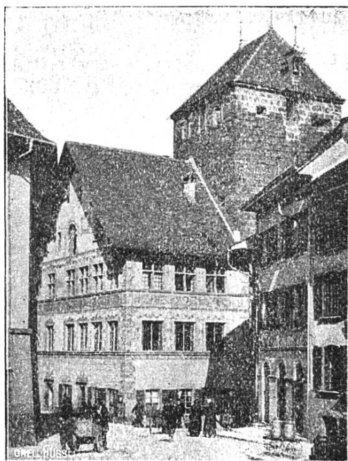
Rathaus zu Brugg.

Brugg 48 Pferde; zu je 2 Pferden noch ein Mann, und im ganzen 10 Wagen sofort nach Baden abgehen. Als am 6. März ein Teil der französischen Armee in Bünden eindrang, die Oesterreicher dort schlug, gefangen nahm und das Volk entwaffnete, so wurden 60 Anhänger der Besiegten nach der Festung Narburg gebracht. Da die österreichischen Kriegsgefangenen gewöhnlich nur eine schwache Bedeckung hatten, so kam es vor, daß mehrere entwichen oder hie und da von Unverständigen, die nicht an die Folgen dachten, verborgen wurden. Mit Rücksicht auf diese Umstände wurden auch die Unterstatthalter — so in Brugg unser früher schon genannte Frölich — aufgefordert, bekannt machen zu lassen, daß u. a. „alle Agenten, Municipalitäten, Dorfwächter, Bannwarte, Hatzchiere bei ihrem Eid darauf achten sollen und die ganze Gemeinde, in welcher bewiesen werden könnte, daß darin solch' kaiserliche Ausreißer beherbergt und verschickt worden wären — ohne diesem Befehl Genüge zu tun — nicht nur für allen Schaden haften müßte, sondern sich offenbar in Gefahr von militärischer Exekution setzen würde.“