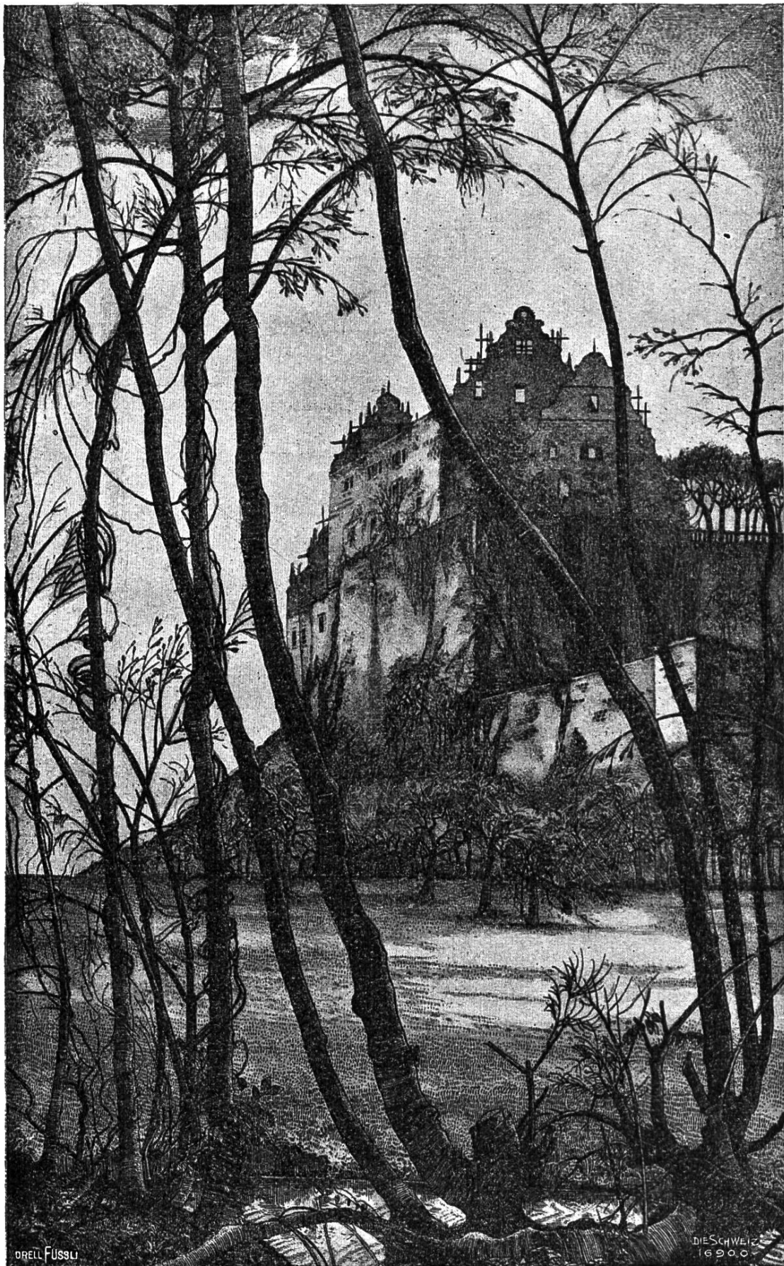
Schloßruine Kasteln (Rad. v. E. Anner).