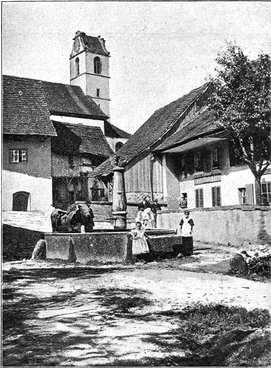
Kirche von Schinznach vom Schulhausplatz.