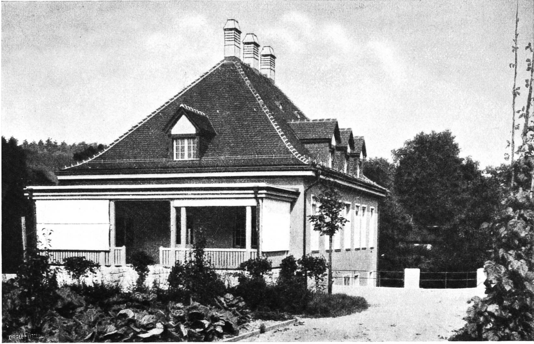
Bezirkshospital Brugg. Absonderungshaus.