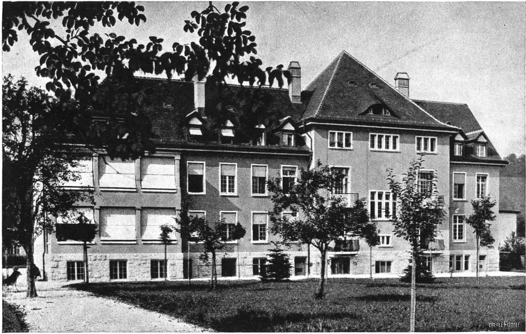
Bezirksspital Brugg. Hauptgebäude.